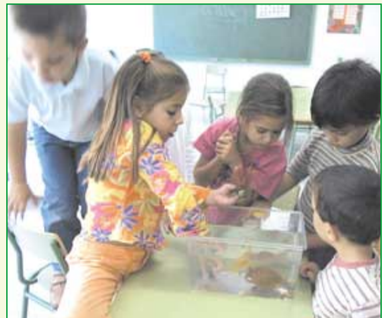
Una de las clases menos numerosas este curso

Por su parte, el Colegio Público Félix Zapatero ha dado la bienvenida al nuevo curso escolar con una parte del edificio en obras. Se trata de unos trabajos de ampliación que comenzaron el pasado 10 de septiembre y que se espera que concluyan a principios del mes