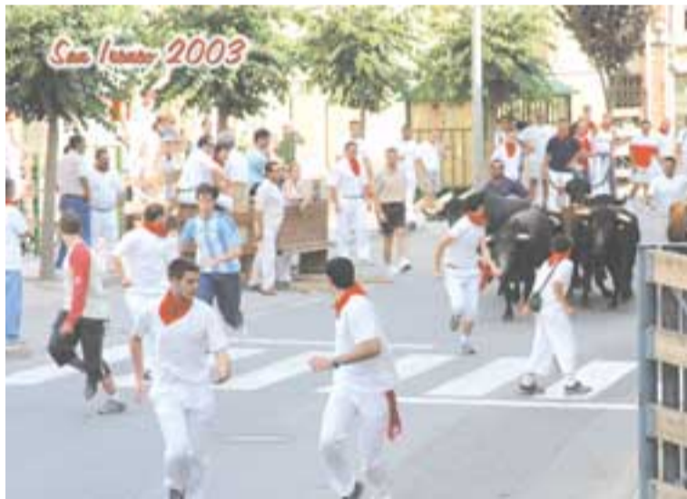
El ambiente durante los encierros fue inmejorable

Recientemente se han puesto a la venta los vídeos de fiestas de 2002 y 2003. Adquirir uno sólo cuesta 18 euros y los dos, 26. Los vecinos que hayan reservado sus copias ya pueden pasar a recogerlas por las oficinas municipales, mientras que el resto de interesados pueden hacer su reserva a través del 012.