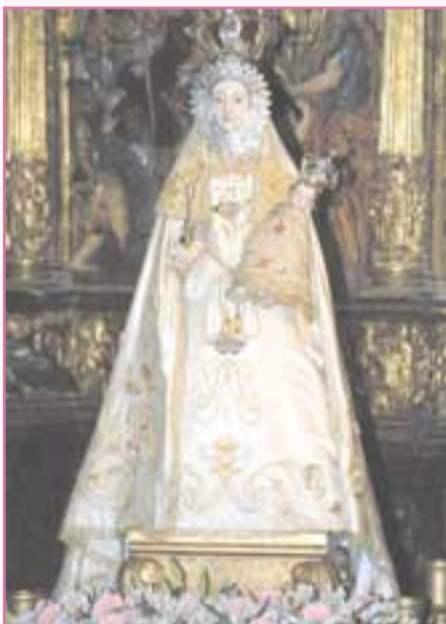
La imagen de la Virgen totalmente renovada

Ya el domingo 14, festividad de la Virgen de