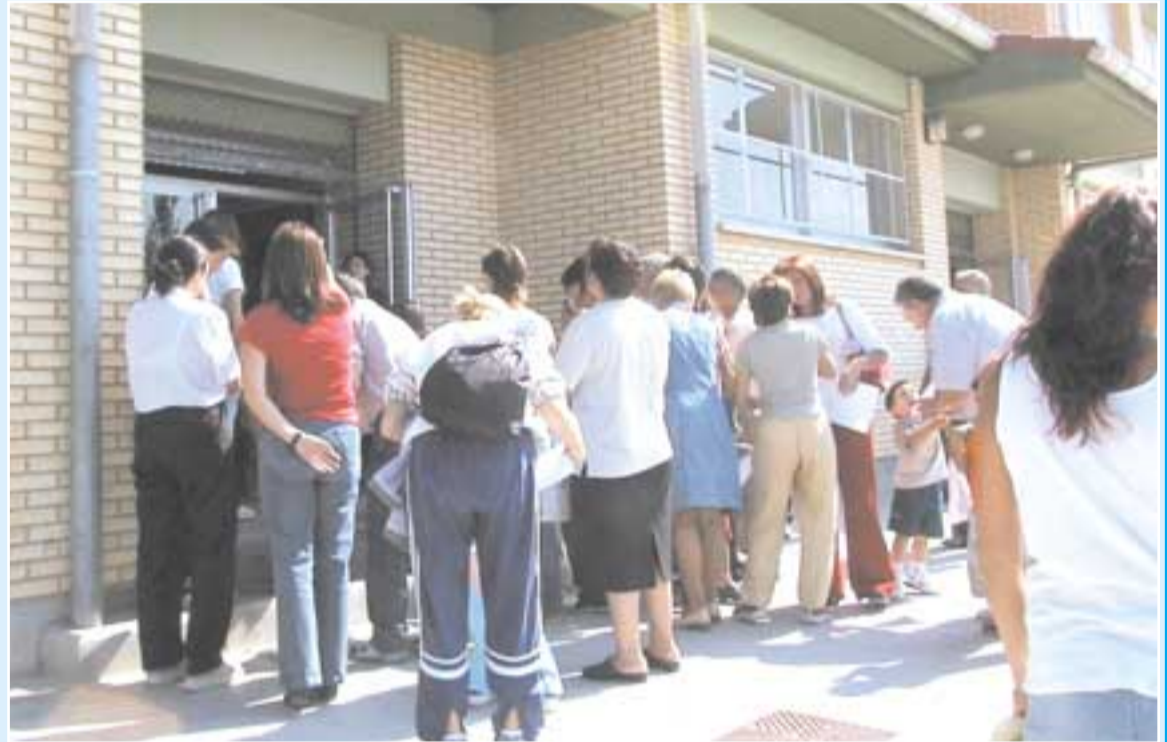
Un grupo de madres aguardan la salida de sus hijos