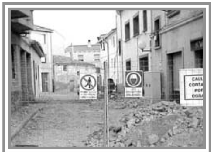
La calle Palacio cortada al tráfico por las obras.

Estas labores ocasionarán un deterioro del pavimento que obliga a su reemplazo. La pavimentación se extenderá en una superficie total de 3.754 metros cuadrados. De ellos, en 2.959 se aplicará hormigón; en 540, adoquín de hormigón; y en 355, baldosa hidráulica.