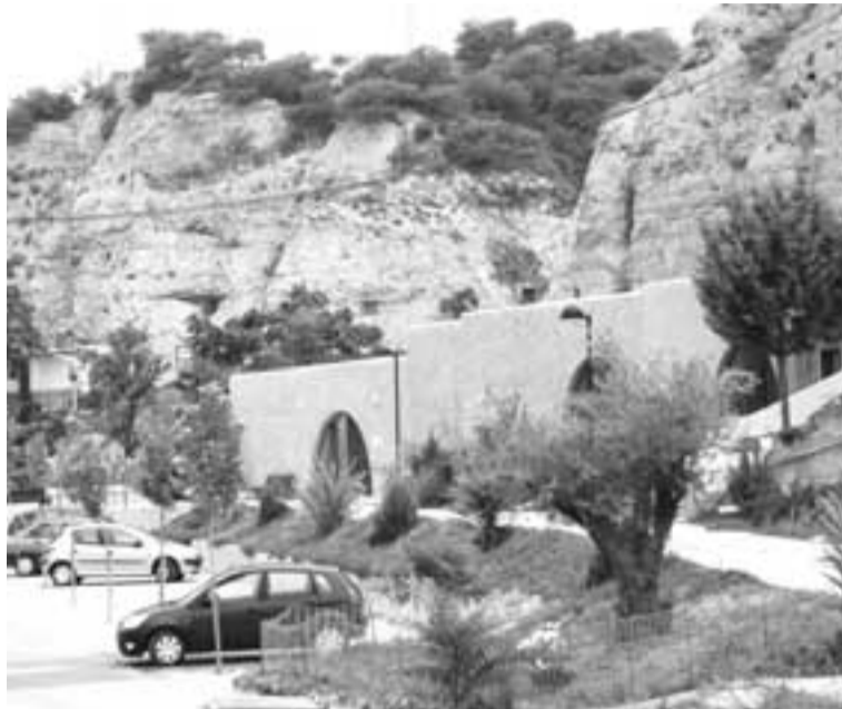
Exterior de las cuevas de Valtierra

El mismo documento establece que la empresa de Teresa Cardona deberá abonar al Consistorio la cantidad fija de 365 euros al mes, en concepto de alquiler de las 6 cuevas, más otra cantidad fija de 312 euros al mes, por el alquiler de la cueva-bar. A estas cifras es preciso añadir un montante mensual variable que la empre-