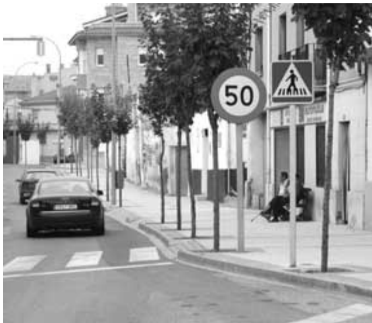
Algunas de las señales colocadas en la travesía Paseo de la Ribera

Los cambios más importantes afectarán a las calles Teófilo Moriones, Raso de Santa María, Mayor, Cabezo de la Junta y Riel, así como a los accesos y salidas a la travesía y a algunas vías colindantes con la carretera.