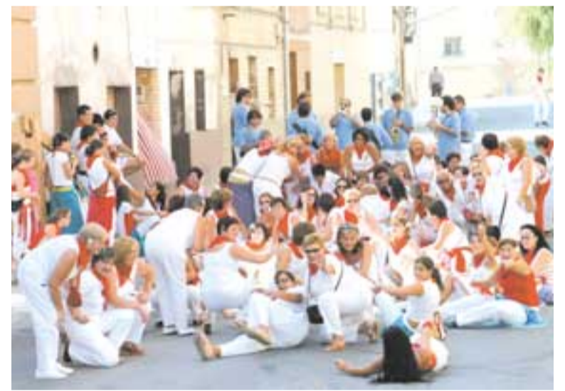
Las mujeres protagonizaron una alegre jornada festiva