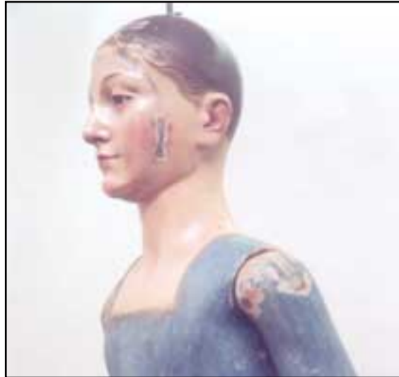
Antes de restauración

Tales desperfectos han requerido un exhaustivo trabajo de reparación, gracias al cual la imagen luce de nuevo radiante. La restauración se ha centrado principalmente en la policromía y reintegración pictórica; la