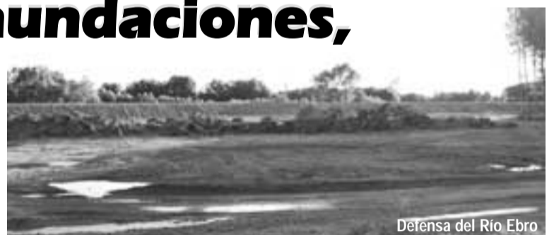
Defensa del Río Ebro