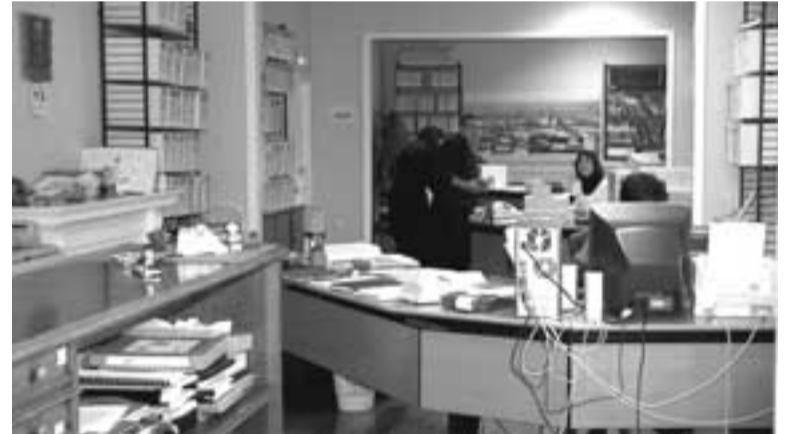
Oficinas del Ayuntamiento

Por último, se hace necesario mejorar la calidad de la oferta de actividades deportivo-culturales, estableciendo un plan de objetivos y actividades a medio plazo, diversificando las actividades, planificando otras nuevas, y mejorando la coordinación entre las distintas áreas y responsables del Ayuntamiento.