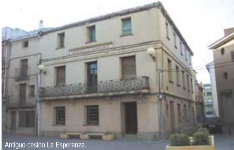
Antiguo casino La Esperanza.

El Ayuntamiento propone la construcción de un centro cívico ideado como un nuevo concepto de servicio al ciudadano.