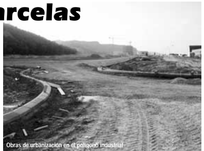
Obras de urbanización en el polígono industrial

Desde la Comisión han asumido de antemano la dificultad que entraña el atraer empresas al polígono municipal por el interés de todas las localidades riberas de lograr el máximo desarrollo industrial. Pero dada la necesidad de generar puestos de trabajo, el proyecto ha adquirido un carácter prioritario.