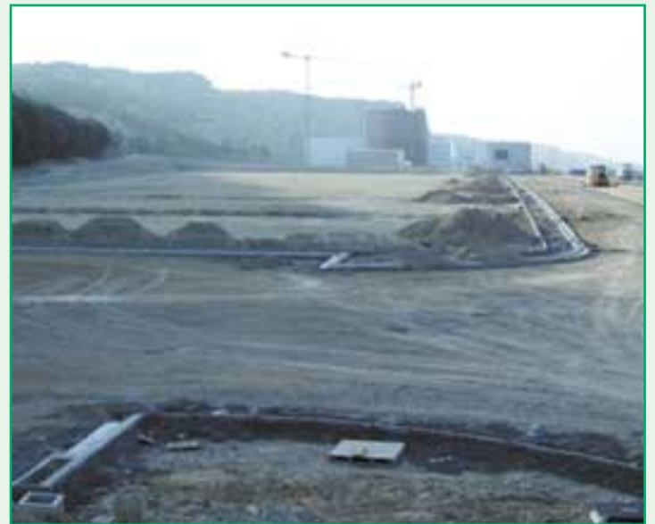
El polígono industrial tras las obras de la primera fase.

Las obras de la primera fase del polígono de servicios de Valtierra no sólo han concluido, sino que todo el suelo disponible ha quedado adjudicado, recientemente. Un total de siete empresas (cinco de Valtierra y dos de Arguedas) se han hecho con las once parcelas en que fueron distribuidos los 36.000 metros cuadrados de superficie del área industrial del municipio y su establecimiento definitivo se hará efectivo de aquí a dos años.