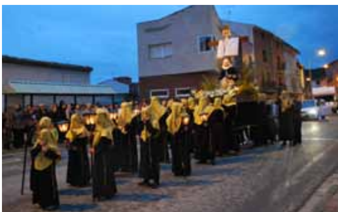
La lluvia hizo acto de presencia durante la procesión.