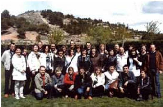
Quintos de 1964