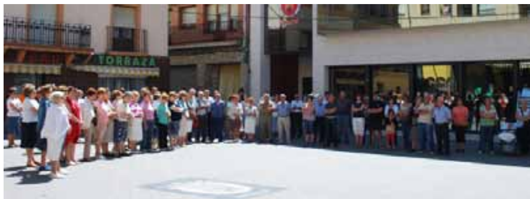
Más de 100 personas se concentraron en la Plaza de los Fueros. / MONTSE.

El pasado día 20 de junio más de un centenar de personas se concentró en la Plaza del Ayuntamiento para mostrar su condena a ETA tras el último asesinato perpetrado por la banda terrorista en la loca-