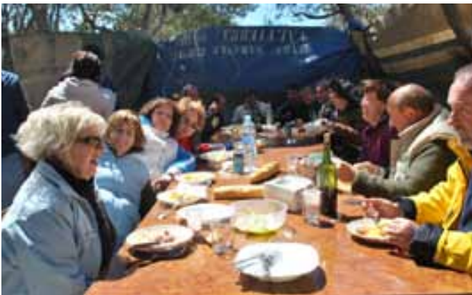
La comida fue uno de los momentos más esperados por todos.

El Día de la Bici volvió a reunir a decenas de personas de todas las edades. Pequeños y mayores de Arguedas, Castejón y Valtierra se concentraron para disfrutar de sus bicicletas y del buen ambiente que reinó durante toda la jornada. Cerca de un centenar de personas de Valtierra se dieron cita en el evento.