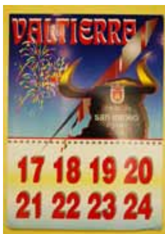
Cartel ganador "Nuestros días".

En el BIM anterior ya anunciamos la contratación de las orquestas para este mes de agosto. Debido a la crisis mundial en la que estamos inmer-