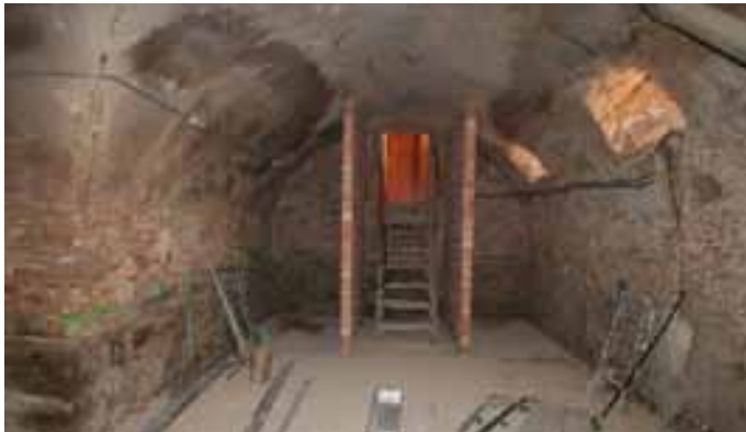
Actuaciones en la bodega del Ayuntamiento. / ENFOQUE.

El presupuesto de las obras, que asciende a 382.653 euros, dará empleo a 30 personas de las que 19 serán de integración