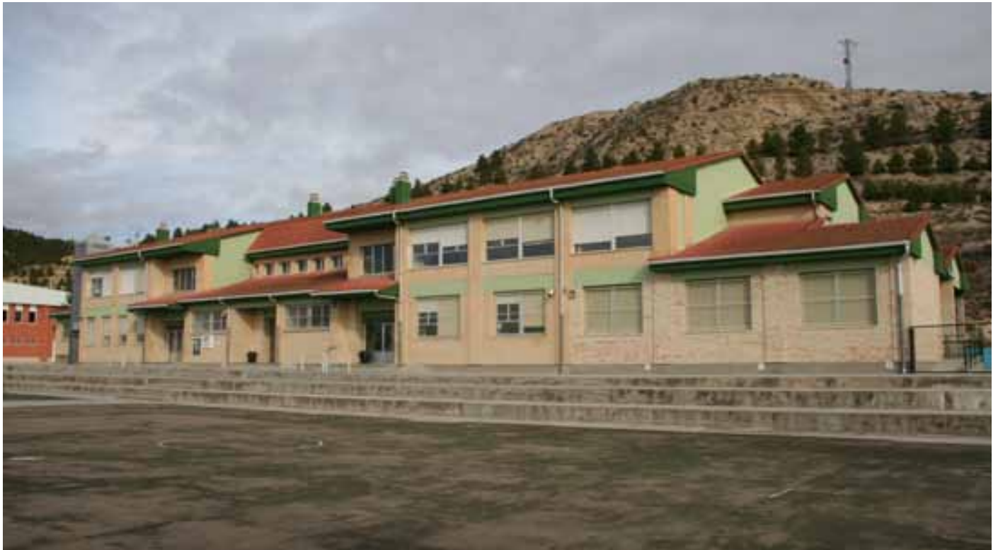
Las nuevas instalaciones se construirán anexas al colegio Félix Zapatero. También se reformarán las actuales pistas del patio / ENFOQUE.

El Ayuntamiento de Valtierra ha firmado con Educación un convenio de colaboración para construir el centro de 0-6 años