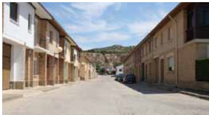
Vista de la calle El Guitarrico, que se reformará este año.

En los capítulos de ingresos el más importante es el de transferencias corrientes destinadas a financiar los gastos corrientes entre las que se encuentran como relevantes las que se reciben de la Administración. Aunque hay que destacar también partidas de los capítulos I, II, III como la contribución rústica y urbana (impuestos directos), licencias de obras (impuestos indirectos) y tasas.