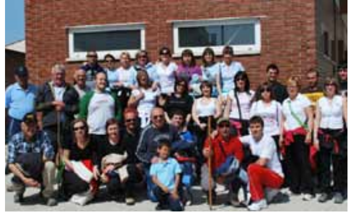
Los senderistas quedaron muy satisfechos con la jornada.