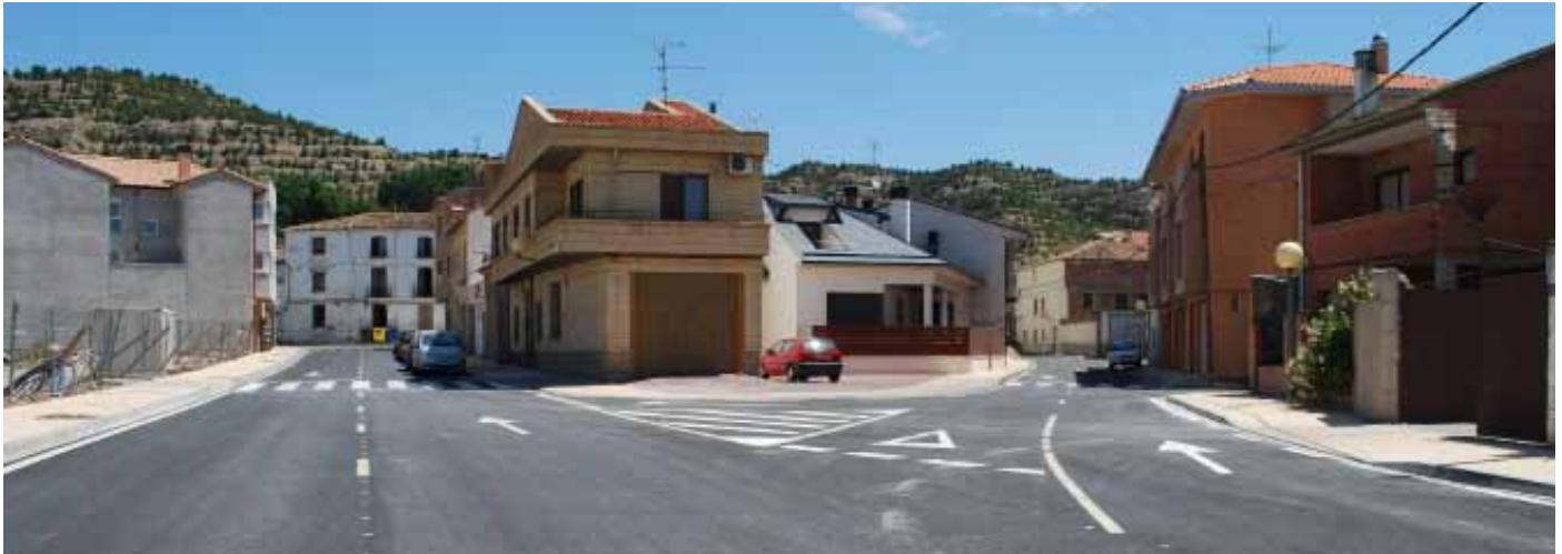
Estado de las calles Riel y Cabezo de la Junta.

Las obras ponen punto y final a las actuaciones del Plan Trienal previstas para el pasado año