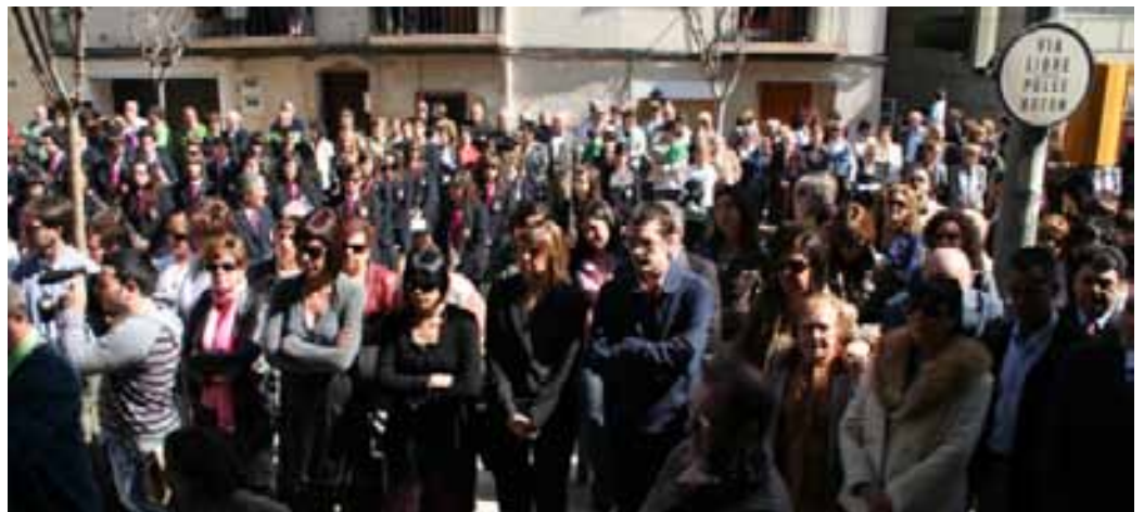
Multitud de gente acompañó a las autoridades el día de la inauguración oficial.