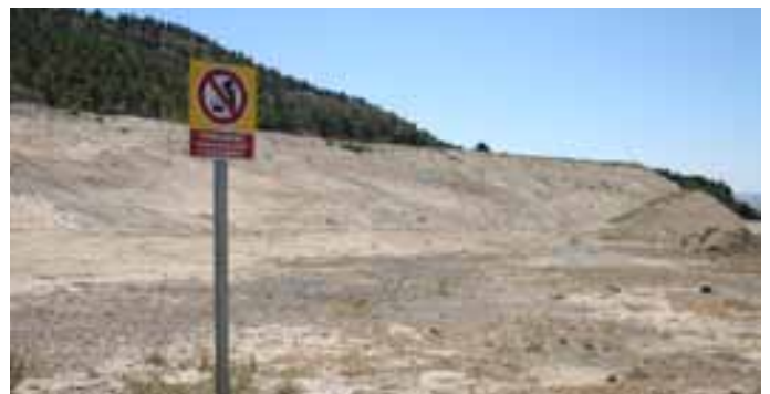
La zona ha quedado completamente limpia de escombros.

pasará a tener un uso recreativo dada la voluntad del Ayuntamiento de aprovechar el espacio como una zona ajardinada para darle uso como mirador y zona de juegos. Por esta razón, el Ayuntamiento invita a respetar un entorno que alguno ya ha comenzado a utilizar como zona de ocio para sus vehículos a motor, actividad que queda terminantemente prohibida y que será perseguida con las debidas sanciones.