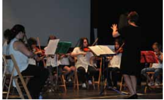
Varios alumnos hacen alarde de su habilidad con el arco.

Con motivo del día del libro, numerosas fueron las actividades organizadas. Una de las más destacables fue la del concurso de marcapáginas. El concurso se lo adjudicaron Ángela Díez Resa y Robin Gómez Pruna. Sus diseños están ya plasmados en un marcapáginas que puede obtenerse en la Biblioteca Pública.