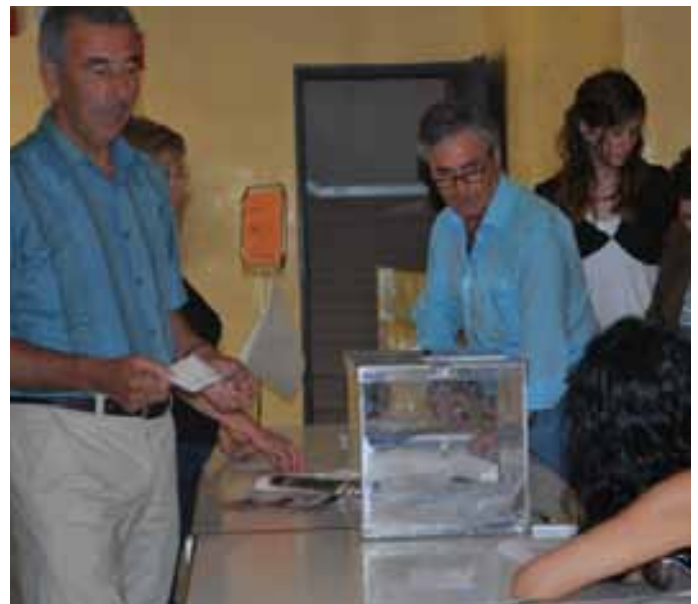
Un valtierrano ejerce su derecho de voto.