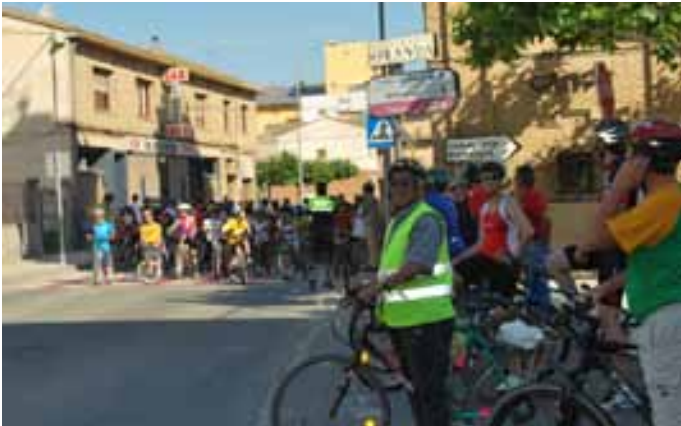
La lluvia respetó una jornada que resultó muy concurrida. / MONTSE.