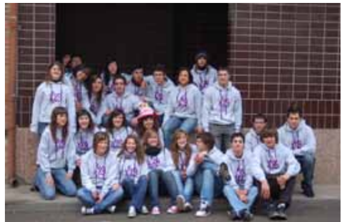
Quintos de 1989