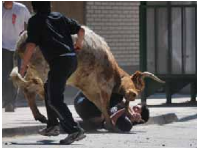
Momento de peligro en las vaquillas. / MONTSE.