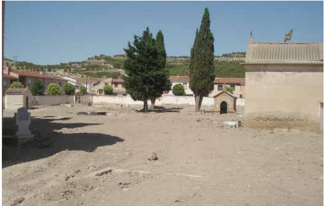
El solar del viejo cementerio se convertirá en un parque.