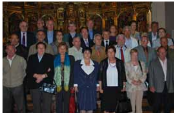
Quintos de 1944