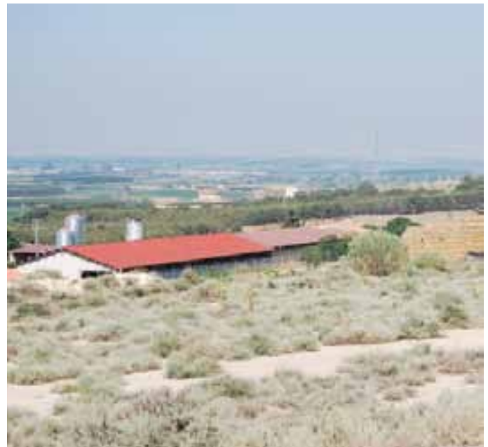
Ampliación del polígono ganadero.