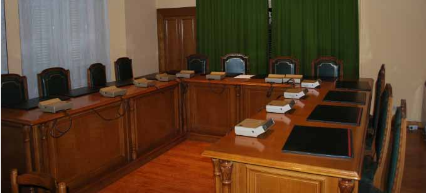
Vista del salón de plenos del Ayuntamiento de Valtierra.

Se firmó un manifiesto con motivo del inicio de la democracia en los Ayuntamientos