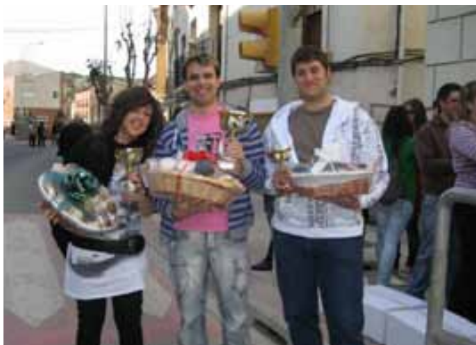
Ganadores del concurso de lanzamiento de puntas de espárrago. / D. DUBLÁN.