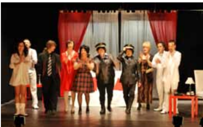
Los actores agradecieron el calor del público.

Un años más, los Valtieranos y Valtieranas iniciaron su tradicional romería hasta la Ermita de la Virgen del Yugo. Una vez allí, el Párroco D. José Miramón ofreció una Misa junto al párroco de la vecina localidad de Arguedas. No faltaron en la jornada las viandas para completar un día de devoción y ocio.