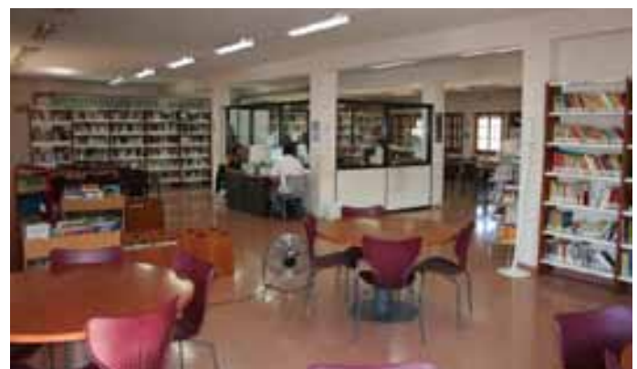
Dos usuarios consultan información en la Biblioteca.

miento de Valtierra ha optado por la instalación de dos calderas de gas independientes que maximizarán su rendimiento en un edificio con las características citadas. "Confiamos en que para el próximo invierno esta nueva infraestructura mejore la climatología del inmueble y que las personas que hacen uso tanto de una parte como de otra del edificio se sientan más cómodas y a gusto en su utilización", concluye D. Alfonso Mateo. El coste aproximado de la climatización asciende a unos 25.000 euros.