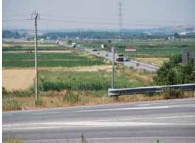
El estudio contempla habilitar suelo a ambos lados de la Carretera.

Con los trabajos de concentración parcelaria avanzados como base, el Ayuntamiento de nuestra localidad ha mantenido conversaciones con Tracasa, empresa responsable de la concentración; y con Nasuinsa, empresa pública del Gobierno de Navarra, encargada de impulsar y gestionar polígonos industriales. Dichas conversaciones han posibilitado la solicitud de 30 a 40 hectáreas en la margen derecha de la carretera entre el cruce de Los Abetos y la AP-15, para su asignación a la futura construcción del polígono industrial y de servicios. El Ayuntamiento, con estos terrenos, asegura casi la mitad de sus previsiones, ya que tenía previsto reservar para un futuro casi un millón de metros para zonas industriales, que descontando zonas verdes y viales se quedarían en la mitad.