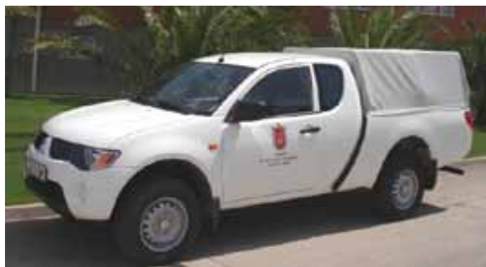
La nueva pick up del Servicio de Aguas ha costado 21.500 €.