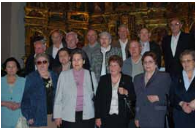
Quintos de 1934

Una de las tradiciones valtierranas más arraigadas es la celebración de las quintas. A lo largo de los últimos meses varias de ellas han celebrado su fiesta. A principios de enero, y celebrando su fiesta oficial, fueron los quintos y las quintas de 1989 que este año cumplieran 20 años y quienes disfrutaron de 3 completos días de fiesta. En Semana Santa, la quinta de 1964 celebró la arraigada fecha de los 45 años. Ambas quintas acompañaron en fiestas actos como el valtirraiu-riau y el día grande de las fiestas. Ya en el mes de mayo, la quinta de 1944 celebró los 65 años; fecha de jubilación para la gran mayoría. Y este año como novedad, la quinta de 1934, celebró sus 75 años.