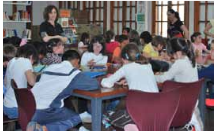
Los escolares plasman sus diseños para el concurso de marcapáginas.

El pasado mes de abril, el grupo de teatro "El Turruntero", de Murchante acudió a la Casa de Cultura de Valtierra para representar la comedia que llevaba por título "Los unos y los otros", una adaptación realizada por Óscar Pérez de la obra "En la otra orilla".