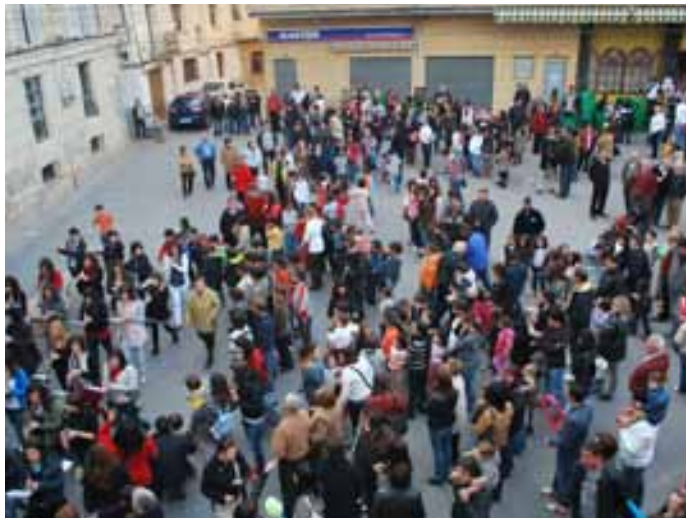
La participación fue importante en todos los actos.