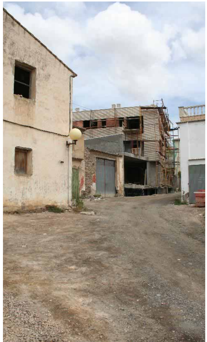
Estado en el que se encuentra la calle Paseo de los Frailes. / ENFOQUE.

En caso de que esta empresa no pudiera ejecutar las obras por las razones que fuese, se efectuaría la propuesta a favor de las siguientes empresas por el orden de puntuación alcanzada. Las más inmediatas son: F.S.C. Suescun Construcciones, Iruña Construcción y Arian Construcciones.