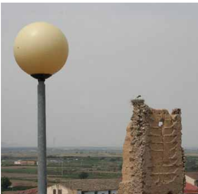
Las antiguas farolas irán siendo sustituidas progresivamente. / ENFOQUE.

La actuación comenzó hace ya unos meses para la sustitución de las luminarias con forma de globo que se vayan estropeando y ahora también se van a cambiar las pertenecientes al Paseo del Castillo/Escuelas. Dicha sustitución ha sido encomendada a la empresa Montajes Eléctricos Pamplona y tendrá un gasto de 10.600 euros más IVA.