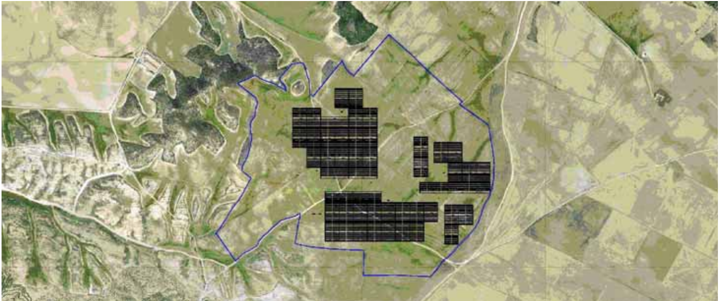
Recreación aérea del nuevo parque solar. / SÍNGULA.

El nuevo parque solar fotovoltaico de Valtierra comienza a tomar forma. Las obras de las instalaciones, que comenzaron a mediados del mes de junio, se desarrollan ya a pleno rendimiento en el término conocido como Tres Caminos .