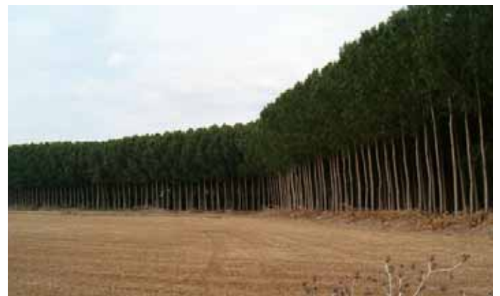
Los chopos son numerosos en nuestra localidad.

Sin embargo, el actual contexto de crisis mundial de las materias primas, la exigencia de que la madera provenga de bosques o plantaciones gestionados de forma sostenible y