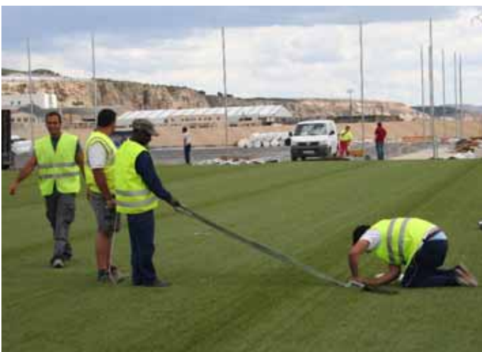
Varios operarios colocan las líneas divisorias del campo.