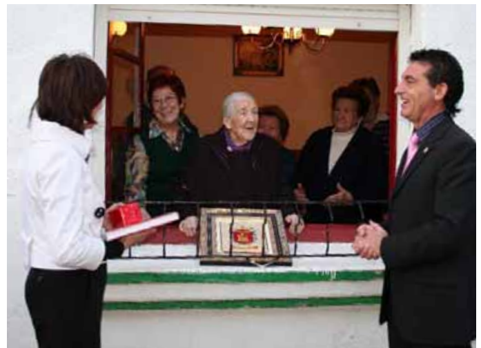
La centenaria fue obsequiada con numerosos presentes. / ENFOQUE.

La valtierrana celebró su centenario rodeada de sus seres más queridos y con el calor numerosos vecinos de Valtierra