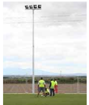
Campo de fútbol 7. / ENFOQUE

COSTE. Desde que comenzaron las obras el pasado mes de enero, han sido muchas las modificaciones que éste ha sufrido. Finalmente, la construcción del nuevo campo de fútbol tendrá un coste total de algo más de 1.300.946,81 euros.