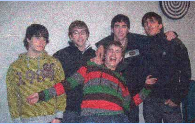
Componentes de Guripas Artean.