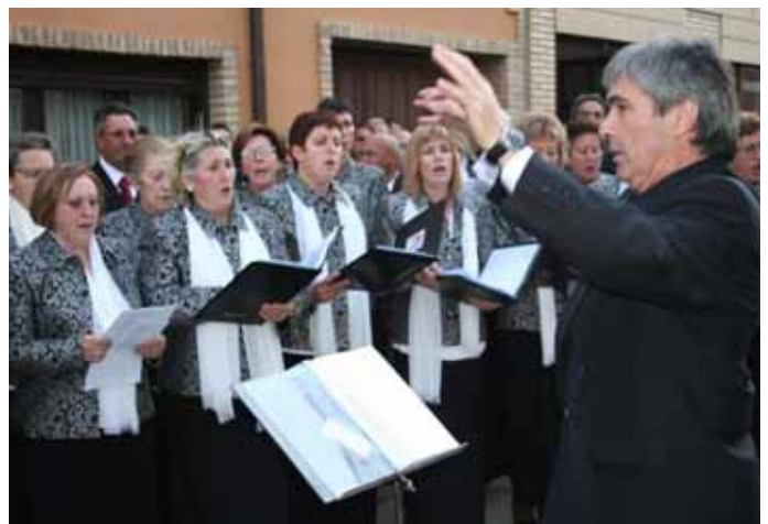
La Coral Virgen de Nieva puso la nota melódica de la jornada.