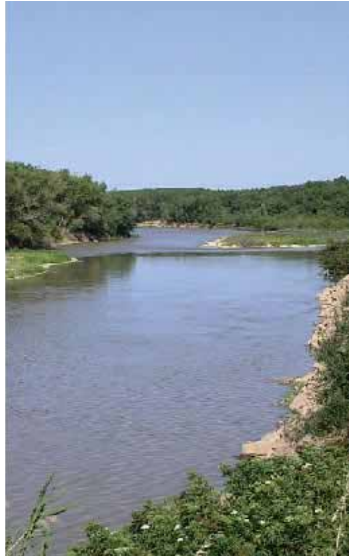
El Ebro causa muchos perjuicios en Valtierra.

Por último se planteó que si el informe declaraba a Valtierra como una zona vulnerable a nitratos, también debería compensarse en la forma que se estimase oportuna.