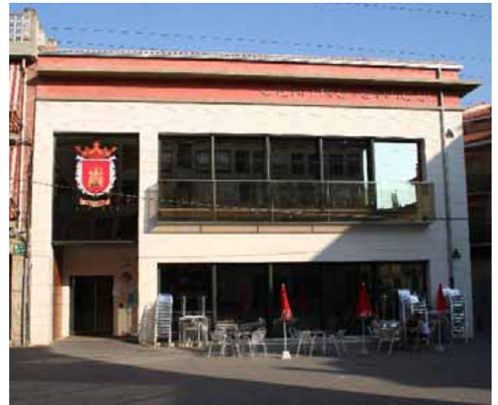
El Centro Cívico ha abierto ya su terraza. / ENFOQUE.

El citado edificio, además de tener su domicilio social, sede para el desarrollo de las actividades del mismo y esparcimiento de sus usuarios, dispone de dos barras de bar, una cocina y un oficio para su explotación, distribuidas en planta baja y primera. El Centro Cívico dispone también de una sala multiusos en la segunda planta. El arrendatario deberá desarrollar directamente la explotación de los citados servicios.