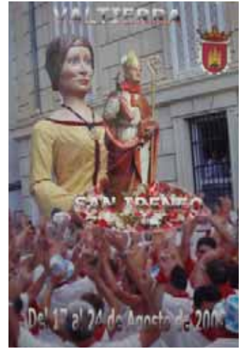
Cartel anunciador de las fiestas.