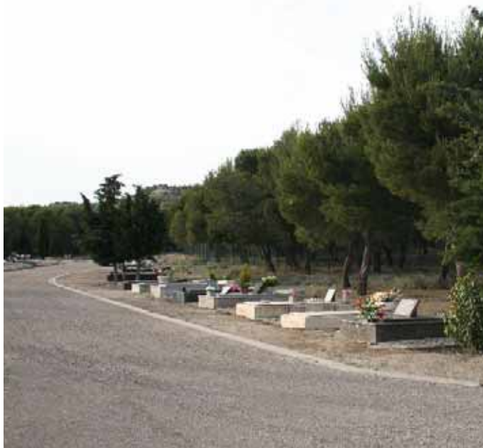
El nuevo cementerio ofrece más espacio para los enterramientos.

El viejo cementerio está clausurado desde 1999, pero todavía quedan algunos restos por sacar. Para poder comenzar los trabajos de limpieza en lo que en un futuro próximo se convertirá en una enorme plaza, es necesario y urgente proceder a sacar los restos que aún permanecen en el viejo cementerio, y también quitar lápidas, cruces... La ley establece un plazo de 10 años antes de realizar actuaciones en los cementerios clausurados.