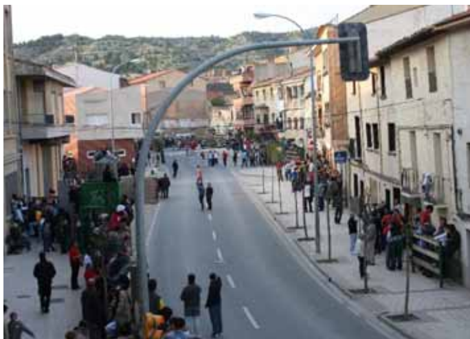
El ambiente en los espectáculos taurinos fue inmejorable.

El buen ambiente, la alegría propia de aquellas fechas y la camaradería se dejó sentir en las calles de Valtierra y arropó a todo aquel que se acercó a nuestra localidad para disfrutar de unas amenas fiestas.