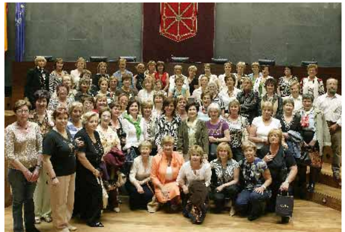
La jornada concluyó con la toma de una fotografía de grupo.

Miranda, con la que charlaron sobre diversas cuestiones de interés. El grupo, procedente de Valtierra ha tenido oportunidad de conocer las distintas dependencias del Parlamento, en el transcurso de una visita guiada que concluyó con la toma de una fotografía en el salón de plenos del Parlamento.