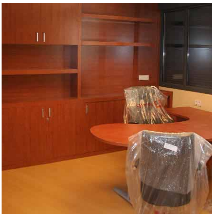
Vista actual de uno de los despachos.

La nueva residencia de ancianos confía en abrir sus puertas a la mayor brevedad posible. Finalizada ya la obra del edificio, los responsables de la nueva residencia se encuentran a la espera de que las empresas encargadas finalicen las labores de amueblado total y concluyan con los arreglos de obra y remates de pintura.