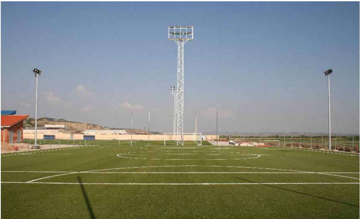
Las instalaciones contarán con un campo de fútbol también de hierba artificial.