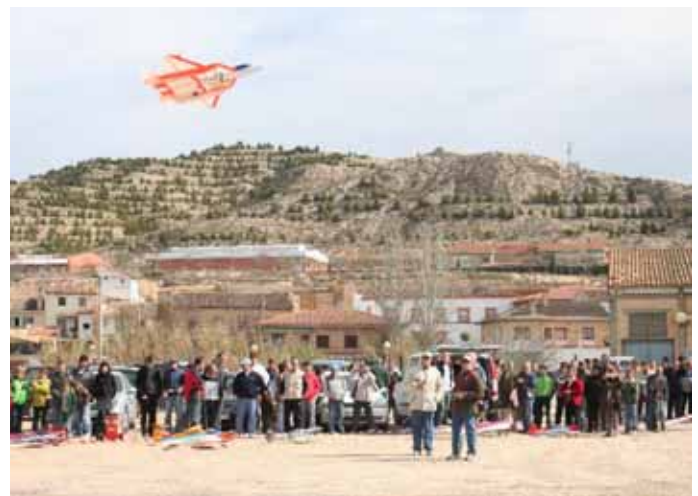
Los aviones teledirigidos volaron sobre el asombrado público.

La música y las vacas fueron, una vez más, los platos fuertes de unas fiestas que tuvieron una gran participación