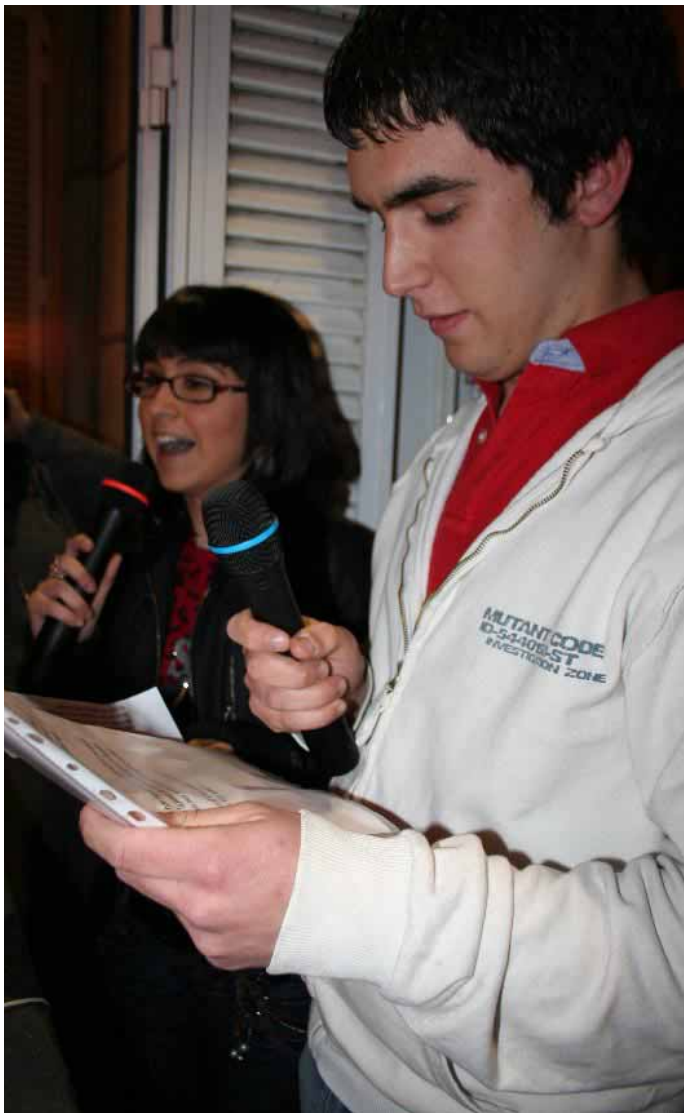
El pregón resultó uno de los momentos más emotivos de las fiestas.

Un año más las Fiestas de la Juventud transcurrieron envueltas en un clima de civismo y convivencia haciendo que el balance final resultase muy positivo para los responsables del Club Juvenil "La Higuera".