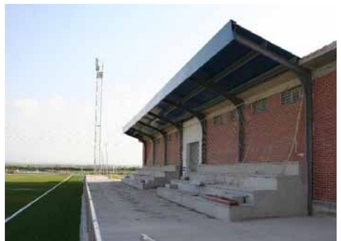
Las gradas son una de las muchas mejoras con las que cuenta el campo.