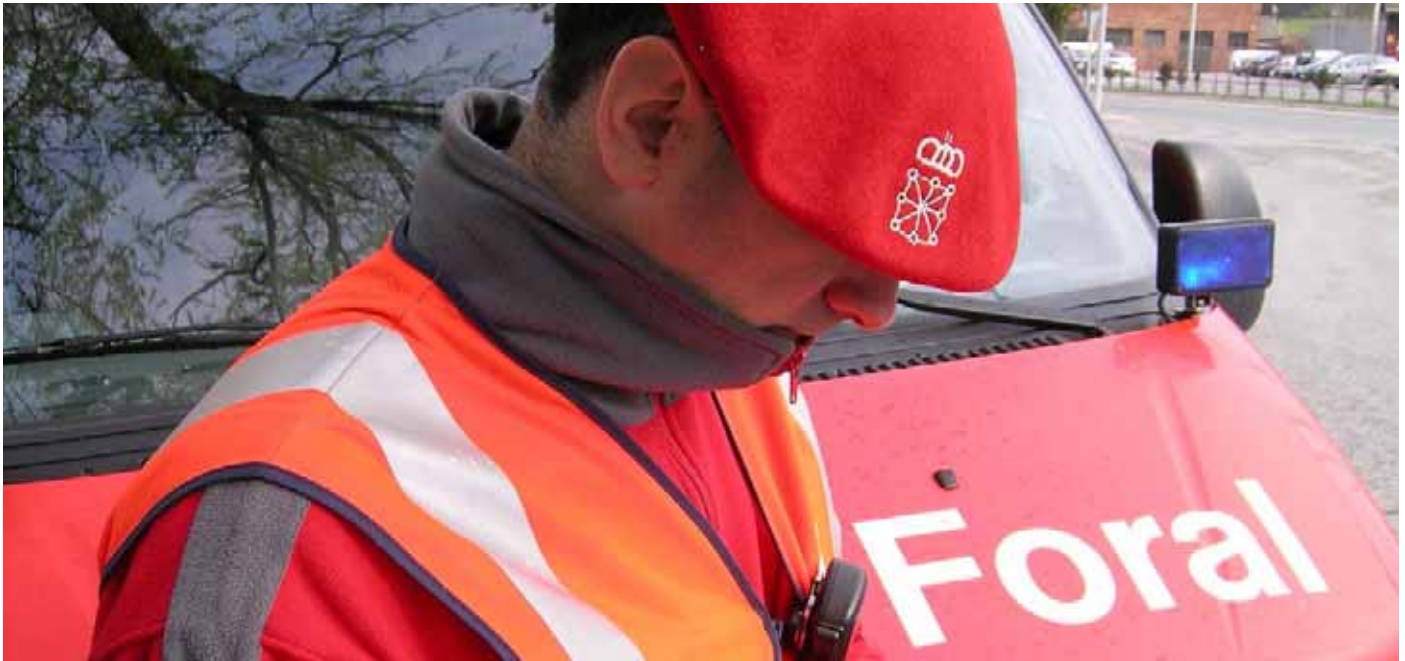
La Policía Foral ha intensificado su vigilancia en Valtierra.

El municipio de Valtierra llevaba una temporada sufriendo múltiples actos incívicos y de vandalismo. En los últimos meses, en la localidad se estaban sucediendo incidentes como robos, rotura de papeleras, denuncias de vecinos respecto de vehículos que circulaban a gran velocidad por el núcleo urbano, acampadas urbanas y utilización de elementos poco respetuosos a horas intempestivas de la noche, entre otros.