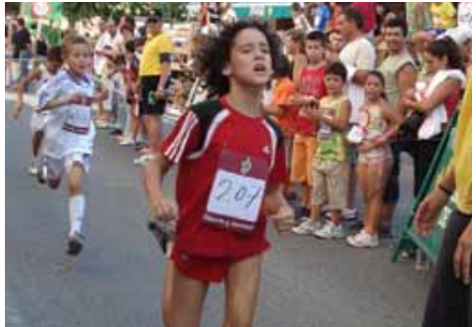
El Cross de San Ireneo registró mucha participación.