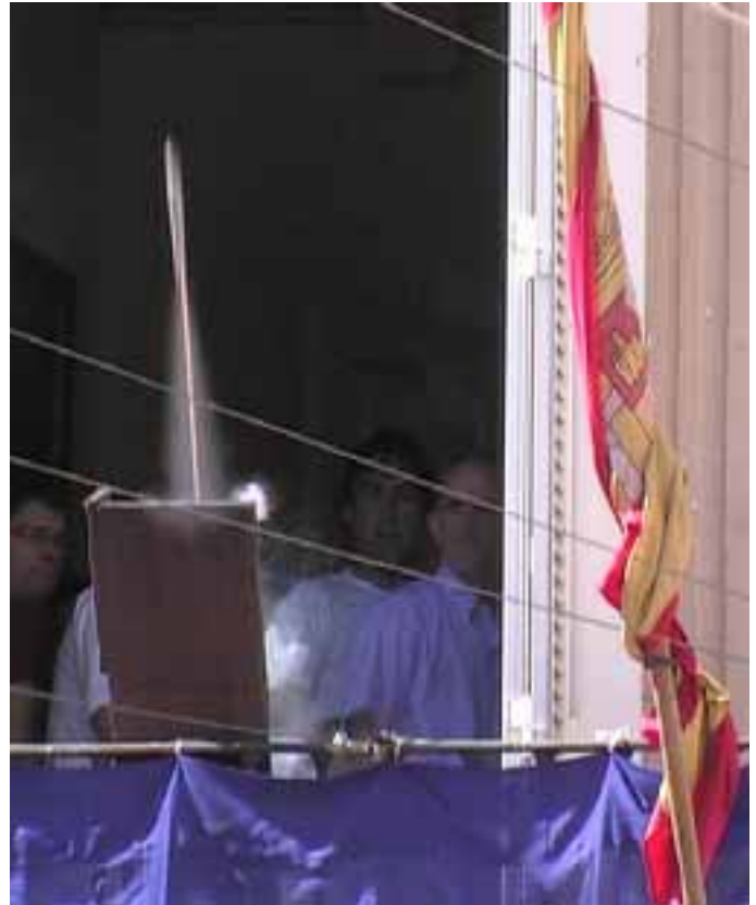
Momento del lanzamiento del cohete.

Y el día 24 de Agosto, día del "Pobre de Mí", tuvo lugar un acto muy novedoso y emotivo, nuestros Gigantes Dña. Blanca de Navarra y Santxicorrota, junto con la Charanga "Los Incansables", se despidieron de todos los valtierranos y todas las valtierranas hasta las próximas Fiestas.