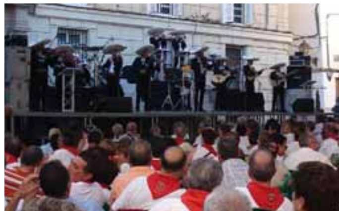
La plaza se llenó durante los conciertos. / LUIS GARDE.