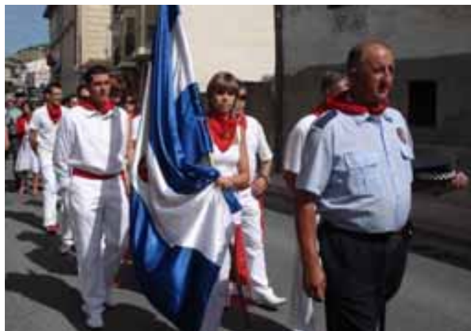
Las autoridades durante la procesión. / LUIS GARDE.