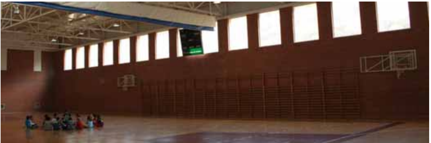
Interior del polideportivo de Valtierra.

El reglamento que rige el certificado de las cartas de servicio de AENOR ha pasado de ser un "Certificado de Conformidad para Cartas de Servicios" a ser una "Marca AENOR N de Servicio Certificado para Cartas de Servicios".