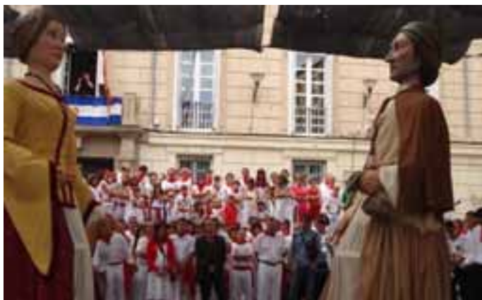
Los gigantes no faltaron estas fiestas. / LUIS GARDE.