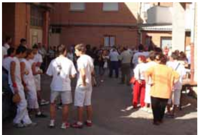
El almuerzo popular del día 17, reúne a mucha gente.