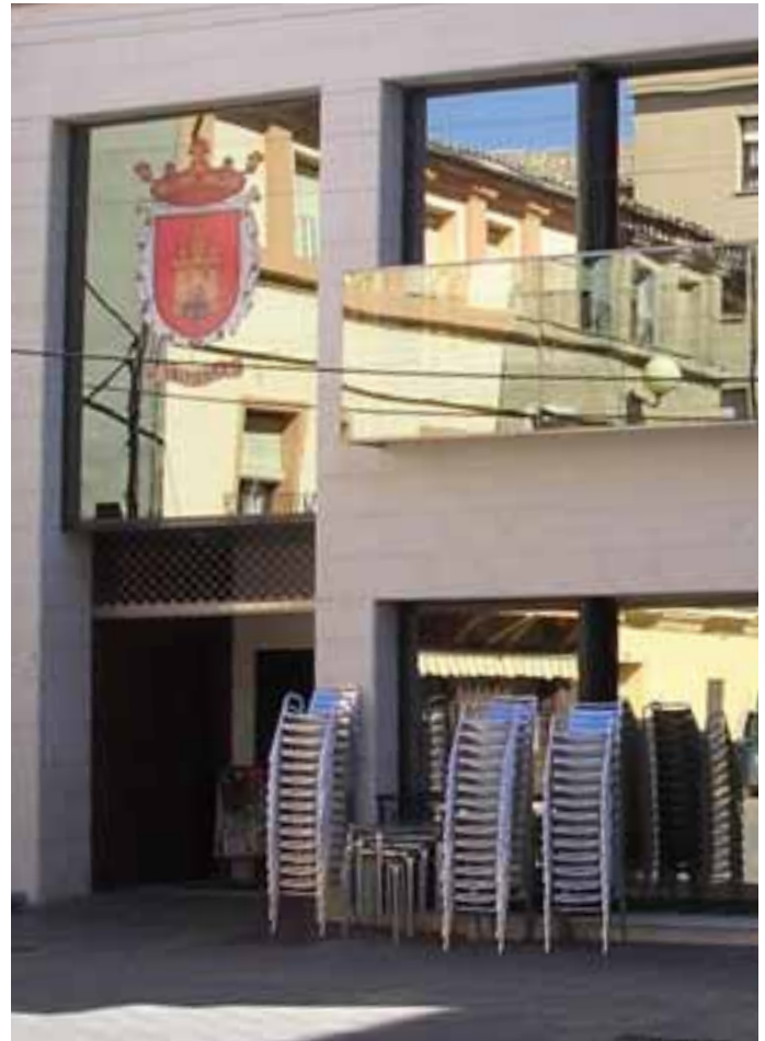
Fachada del Centro Cívico.