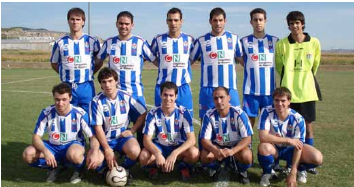
Parte de la plantilla del primer equipo.

El Valtierrano ha comenzado la temporada con la máxima ilusión. La dificultad de la nueva categoría no medra al conjunto de Benito Hualde que ha empezado luchando con fuerza por lograr su objetivo: "Lo que buscamos es conservar la categoría. Si los chavales ponen un poco de entusiasmo e interés y se comportan como lo hicieron la temporada pasada, el