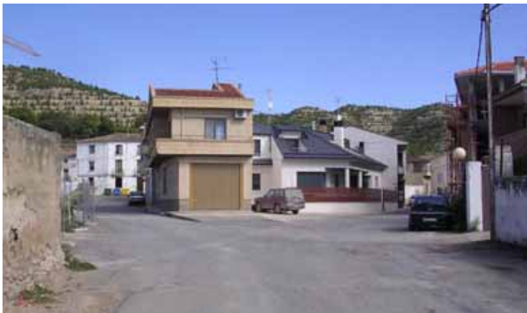
Estado actual de las calles Riel y Cabezo de la Junta.

una cuantía de 1.011.210,31 euros, ascendiendo el presupuesto de ejecución material a 751.493,99 €. Dicha cantidad queda distribuida en 463.490,01 € para la calle Príncipe de Viana, 196.272,18 € para Cabezo de la Junta y 91.731,80 € para la Calle Riel. Un diez por ciento del presupuesto será destinado a gastos generales (75.149,40 €), mientras que el beneficio industrial será del seis por ciento (45.089,64 €). La totalidad del IVA asciende por tanto a 139.477,28 euros.