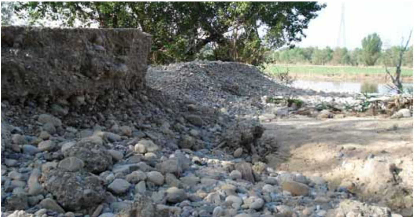
Daños ocasionados por la fuerza del agua durante la pasada riada.

El Ayuntamiento de Valtierra ha estimado oportuno revisar las condiciones del pliego correspondiente a la reparación de las infraestructuras agrícolas que habían sido dañadas durante la pasada crecida del río Ebro y las consecuentes inundaciones. "Nos hemos encontrado con que ha pasado tanto tiempo desde que se hizo el proyecto hasta el inicio de las obras que alguna de las partidas de limpieza de regadíos y de extracción de gravas se ha-