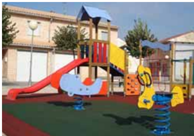
Parque instalado en la Plaza de Europa. / LUIS GARDE.

LICITACIÓN. Al nuevo requerimiento del Ayuntamiento se presentaron tres ofertas, las correspondientes a las empresas Mader Play, Talleres Agapito y Sumalím. Estudiadas dichas propuestas, la Comisión de Urbanismo estimó que la oferta más ventajosa para Valtierra era la ofertada por Sumalím, por un importe de 27.525,58 euros para los tres parques.