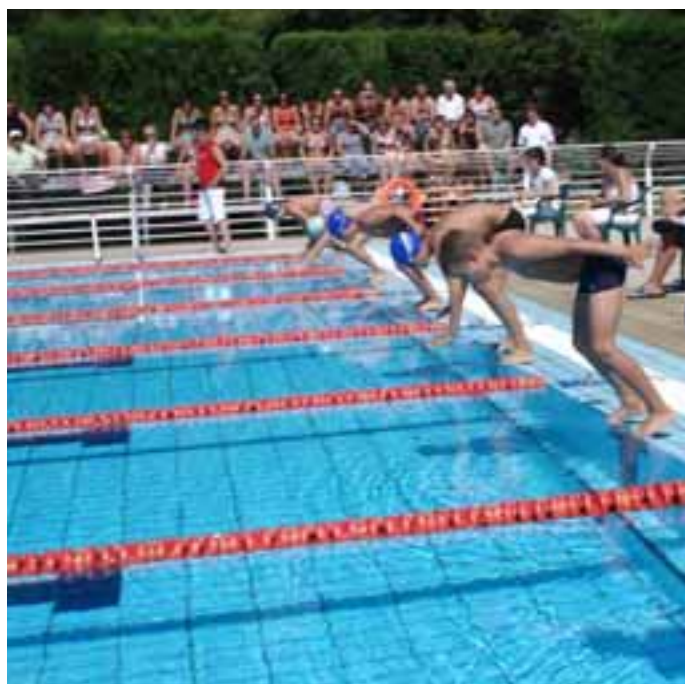
UN grupo de nadadores se dispone a tomar la salida en una carrera.

NUEVO SPONSOR. El Valtierrano ha comenzado la temporada de mano de un nuevo patrocinador. Se trata de la empresa Congelados de Navarra, que apoyará al equipo es su andadura por la presente campaña.