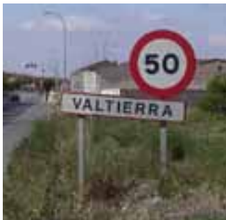
Entrada a Valtierra. / ENFOQUE

El Gobierno de Navarra aprobó el pasado mes de junio el nuevo calendario escolar del centro 0-3 años Nuestra Señora de Nieva de Valtierra para el presente curso 2007/2008. Sin embargo, con aquella aprobación todavía quedaba pendiente realizar o no una modificación según resultase en el calendario oficial de fiestas laborables para el año 2008 para la Comunidad Foral de Navarra, el día 19 de marzo como festivo o laborable. Con fecha 16 de julio de 2007 se publicó en el Boletín Oficial de Navarra la resolución del director general de trabajo por la que se estableció el calendario oficial de fiestas laborables para el año 2008, resultando finalmente el día 19 de marzo de 2008 como día festivo a todos los efectos. Por tanto, se acuerda modificar el calendario escolar para el Centro 0-3 Nuestra Señora de Nieva para el curso 2007/2008, en el cual figurará el día 19 de marzo como festivo y el día 31 de julio como laborable.