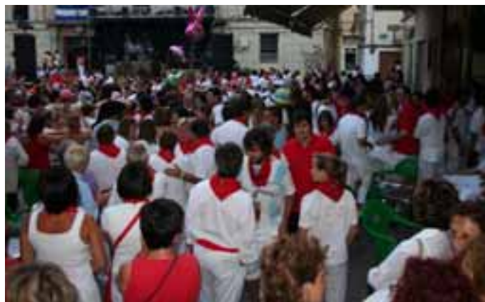
El Valtirriau-riau duró demasiado tiempo. / LUIS GARDE.