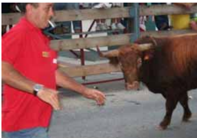
Instante previo a la cogida de un mozo durante el encierro. / ENFOQUE.