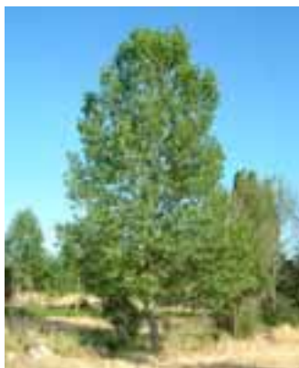
Un árbol de chopo.