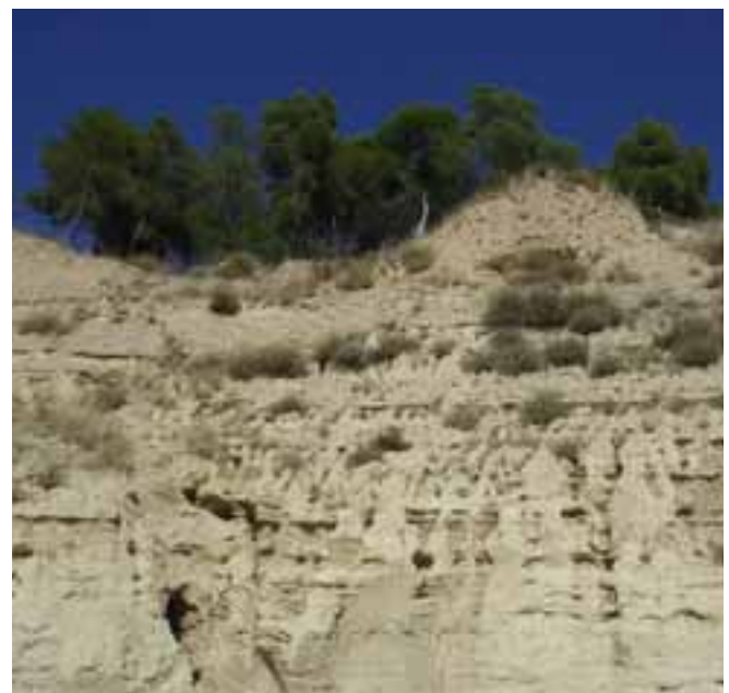
Vista de los surcos causados por la caída del agua.

al casco urbano ocasionando serias inundaciones que afectan a los inmuebles, viviendas y fincas rústicas con los consiguientes daños y perjuicios para la población. El Ayuntamiento de Valtierra también ha acompañado el escrito con el estudio de Salidas de Aguas Pluviales redactado por el ingeniero de caminos, canales y puertos, Francisco Jiménez Gómez en el año 1994. Aquel informe dictaminaba que esta problemática que sufre Valtierra podría verse paliada en el caso de construirse un colector, emisor o escurridor que evacue dichas aguas hasta el río.