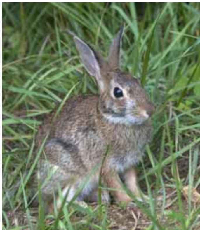
Un conejo mantiene la alerta.