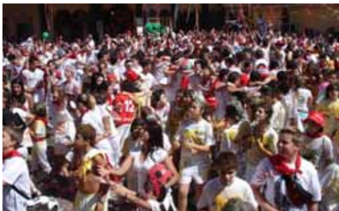
La plaza a rebotar durante el cohete. / LUIS GARDE.