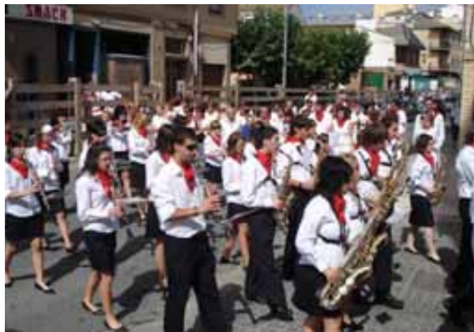
La Banda Municipal no faltó a la procesión.