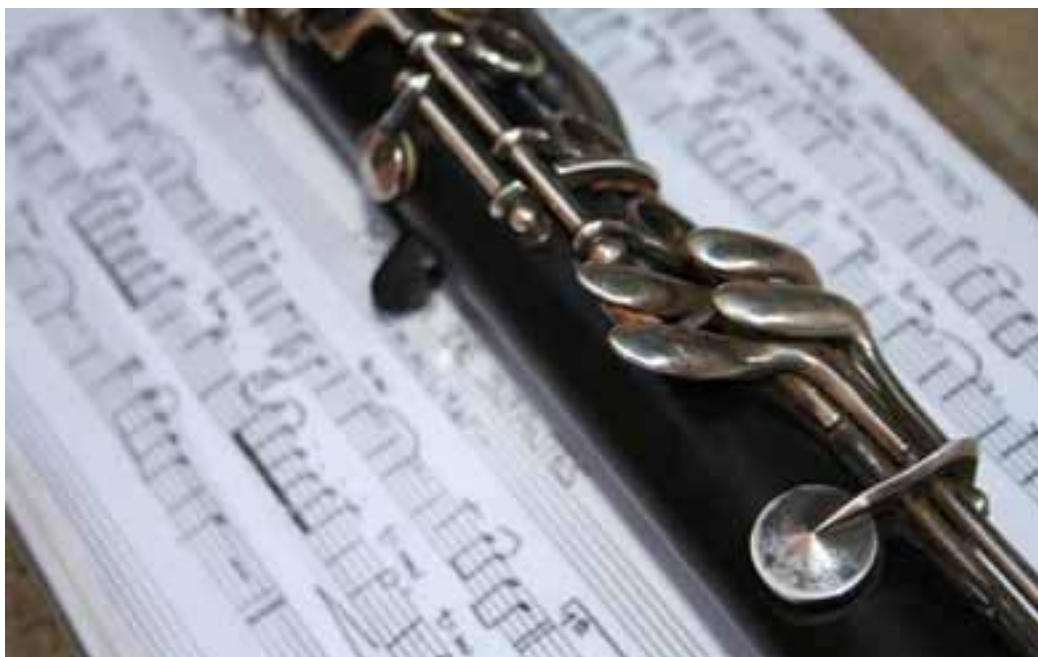
Detalle de una partitura.

El Ayuntamiento ha recibido con buenos ojos la propuesta de muchos padres y madres cuyos hijos asisten a la Escuela de Música de Valtierra que proponía que se tuviese en consideración la posibilidad de efectuar un descuento en el pago de las tasas en dicha Escuela, en el caso de familias numerosas.