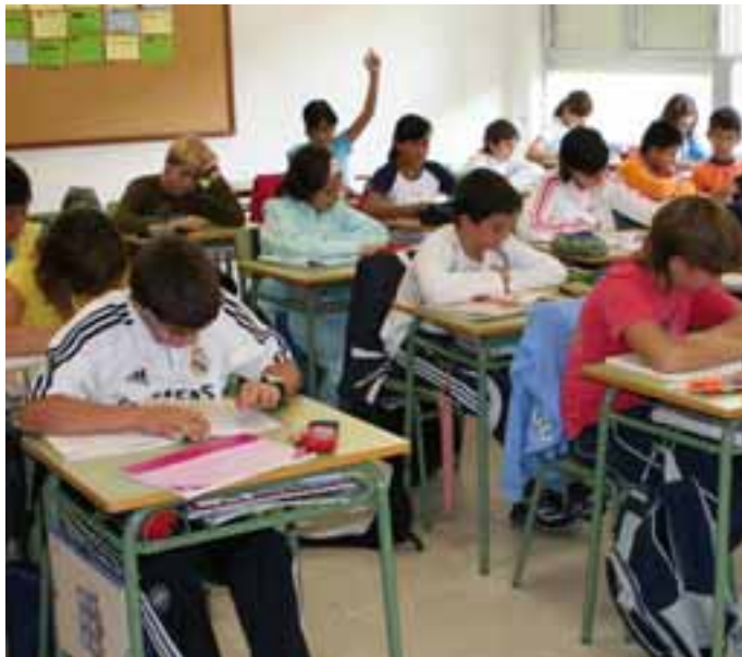
Clase de sexto curso. / ENFOQUE.

Las aulas del Colegio Público Félix Zapatero han vuelto a llenarse para afrontar una nueva etapa escolar. El centro educacional ha abierto sus puertas con un importante lavado de cara y es que el centro ha estrenado una excelente instalación que permitirá el acceso a Internet a todos sus escolares.