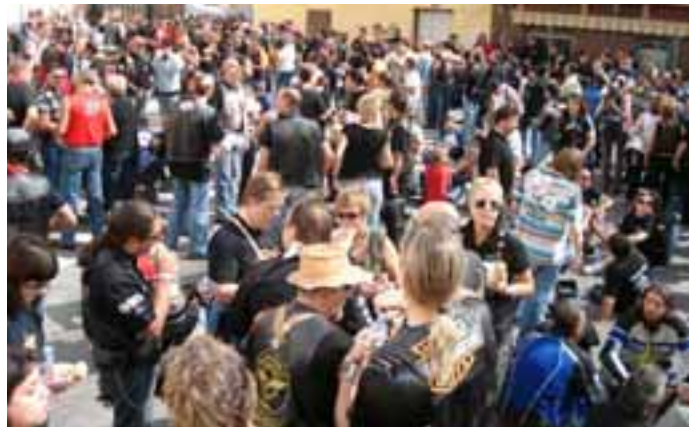
Valtierra recibió la concentración motera. / LUIS GARDE.