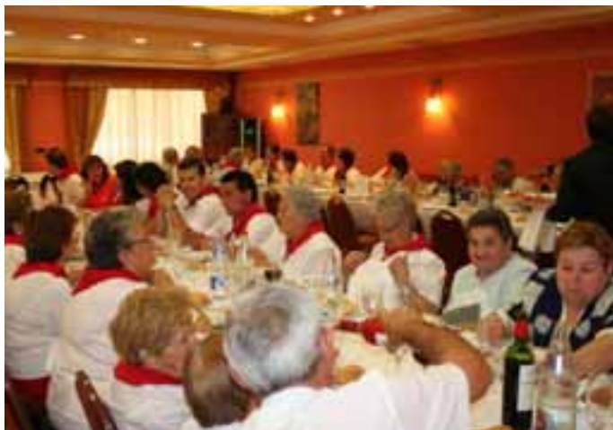
Los jubilados durante la celebración de su día.