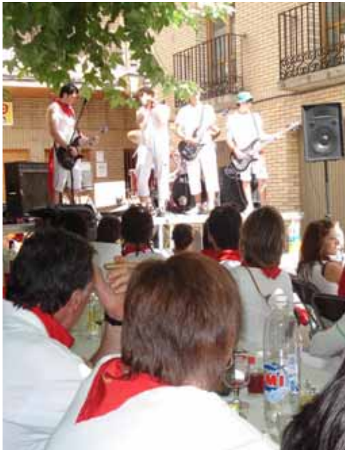
Comida de convivencia de Valtierra Joven, padres e hijos, durante las fiestas.