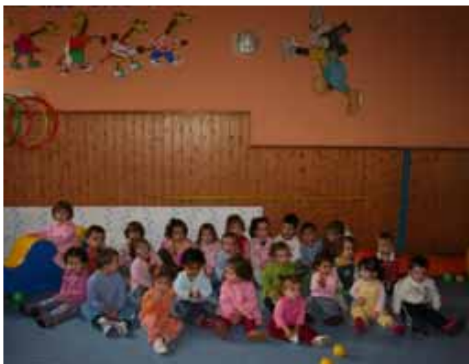
Los "mayores" de la guardería posan en el aula de recreo.