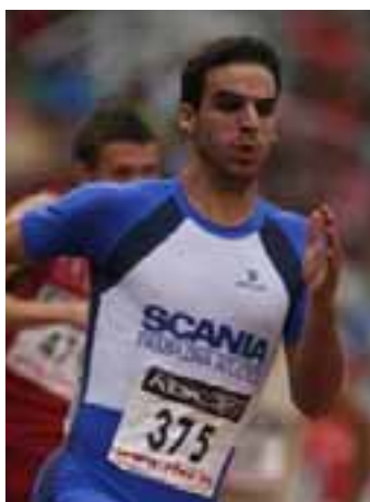
Luis Hualde. / ARCHIVO.