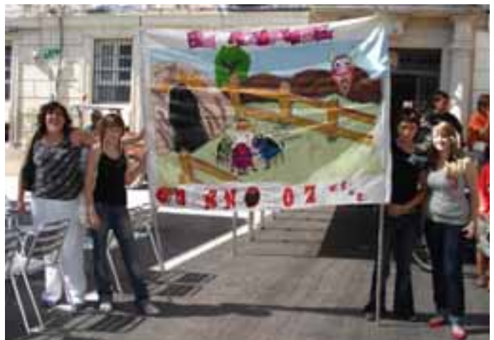
La peña EL Aguante ganó el concurso de pancartas.