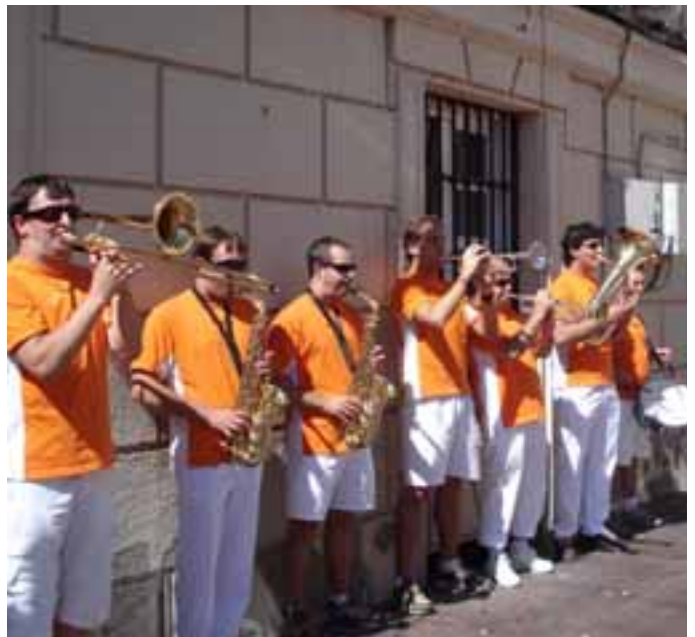
Los Incansables alegraron las calles de la villa.