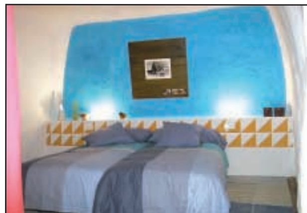
Interior de las cuevas casa.