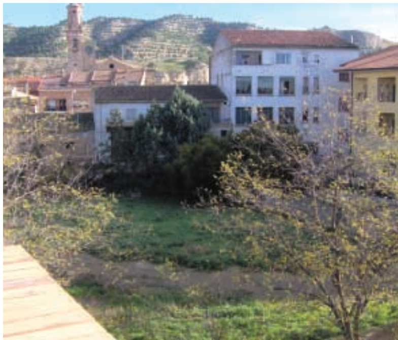
Terreno en el que se construirá la plaza de toros.

A día de hoy resulta complicado establecer una fecha de finalización para este proyecto ya que no depende del Ayuntamiento sino de cómo marche la urbanización que dará comienzo el próximo año. Todavía queda mucho camino por recorrer pero el Ayuntamiento confía que se complete en el transcurso de la siguiente legislatura.