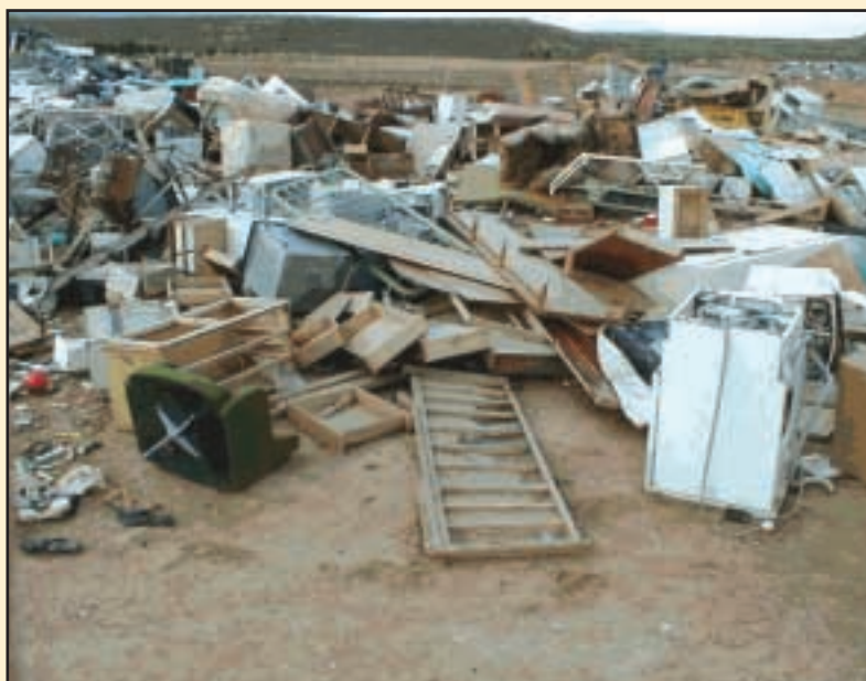
En la escombrera se depositan enseres, mobiliario y material de obras.

El Ayuntamiento, en definitiva, está poniendo en marcha la Ordenanza de la vía pública de Valtierra. La línea de dicha ordenanza era clara: Regular el uso del espacio común de la vía pública y demás zonas que aunque de carácter privado, afecten directamente la convivencia vecinal, por ejemplo los solares privados. A los propietarios de estos solares, el Ayuntamiento les está exigiendo la limpieza y cercado, según establece el Plan Municipal.