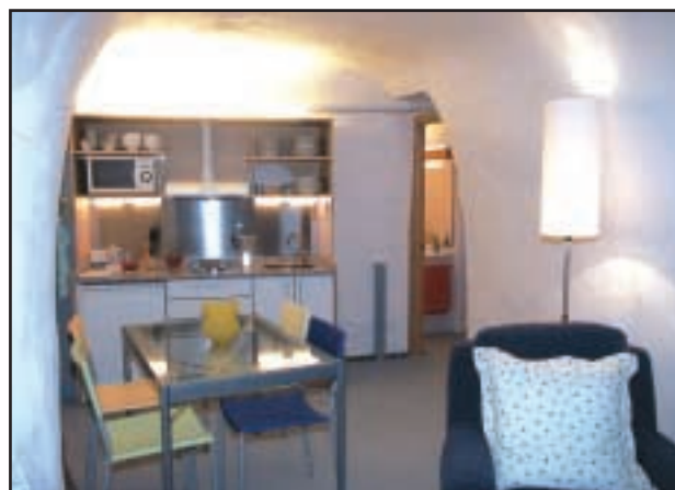
Cocina de una de las casas cueva de Valtierra.

Por otro lado, el arrendatario será libre de organizar y desarrollar todas las actividades de carácter deportivo, cultural, turístico y de ocio que crea conveniente, comprometiéndose como mínimo a la creación de programas de servicios turísticos, culturales, deportivos y de ocio; y a colaborar con las actividades y campañas de difusión turística en general que lleve a cabo el Ayuntamiento de Valtierra, ciñéndose el contratista a los aspectos referidos a las instalaciones arrendadas.