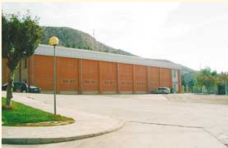
Las inversiones prevén la pavimentación de varias calles.

EL ayuntamiento destina más de la mitad de los presupuestos para inversiones. pág. 6