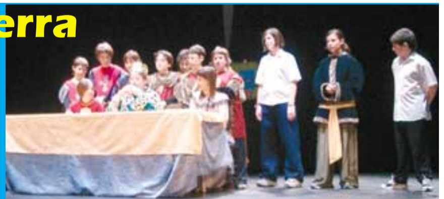
Los jóvenes actores encandilaron al público.

La obra la ensayaron durante los tres meses anteriores a la representación y, aunque hubo algún cambio de personaje en las semanas anteriores a la representación, los jóvenes valtierranos aprendieron perfectamente los textos y se metieron en la piel de los personajes que representaban con gran profesionalidad. La propia monitora que dirigió al