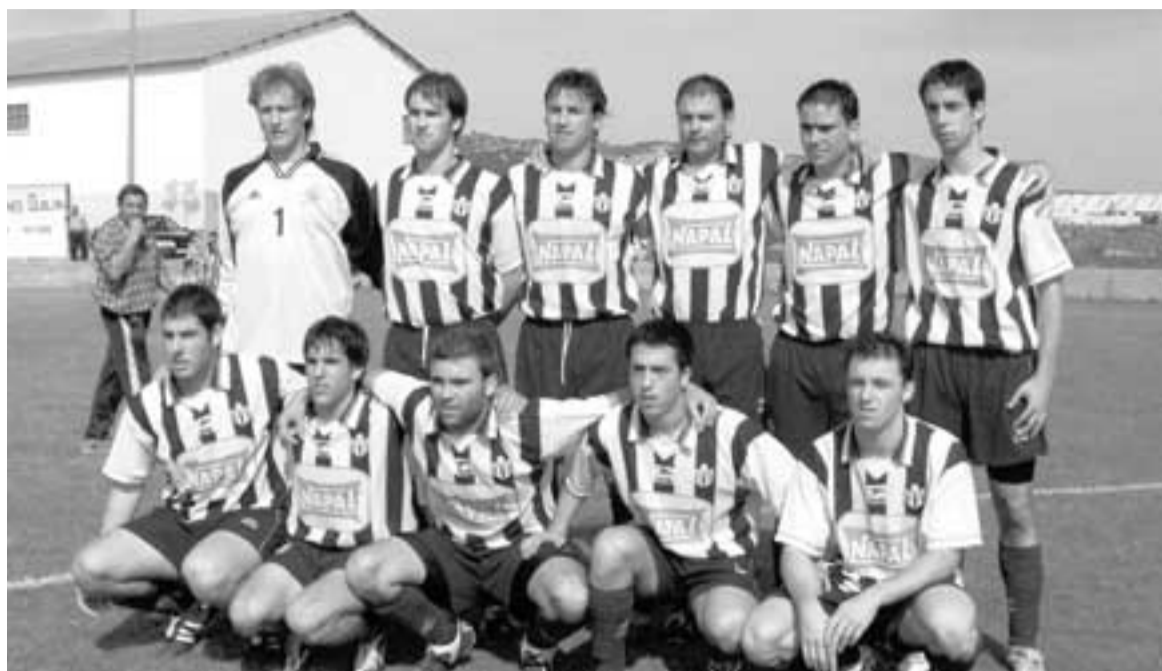
El Valtierano estuvo a punto de ascender a regional Preferente.

El Valtierano cierra así una buena temporada, y ya se dispone a preparar la campaña de 2006-2007. Las ganas e ilusión no faltan en nuestro querido equipo local.