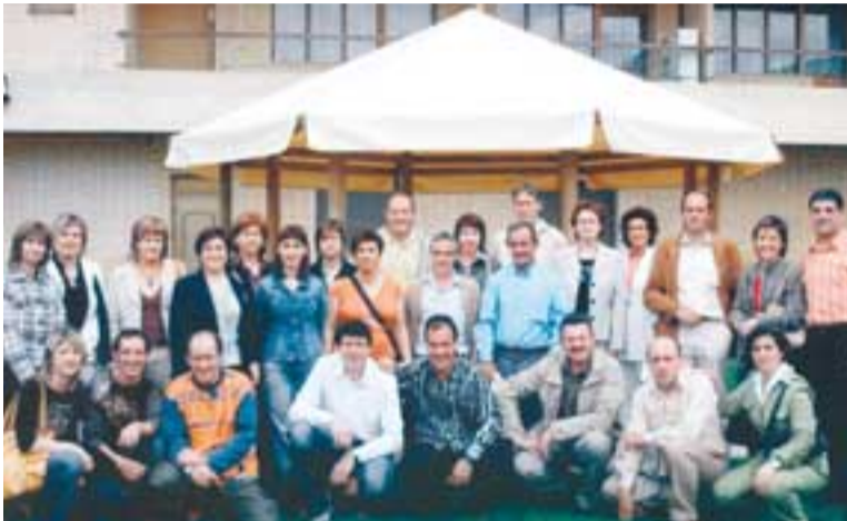
Los quintos de 1961 conmemoraron el 25 aniversario de su día.

Asimismo, los quintos que cumplen 45 años, celebran el 25º Aniversario de la fiesta que