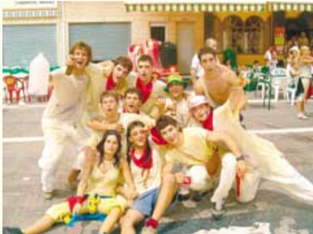
Y durante todas las fiestas nos acompañará la Charanga "Los Incansables"