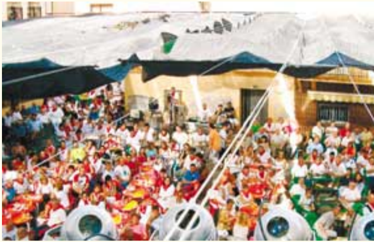
Los conciertos congregan a buen número de valtierranos.

Por supuesto, qué sería de unas fiestas sin unas vaquillas a las que recortar, esquivar y, en