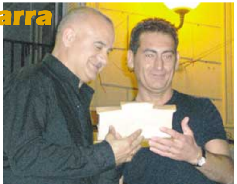
El Alcalde entregó obsequios para finalizar el acto.

recorrieron las calles de la villa y confluyeron todas en la Plaza de los Fueros donde ofrecieron un magnífico concierto conjunto, en un acto que estuvo repleto de público. El espléndido sol que acompañó la jornada invitaba también a disfrutar y unirse a los compases de estos grupos de músicos.