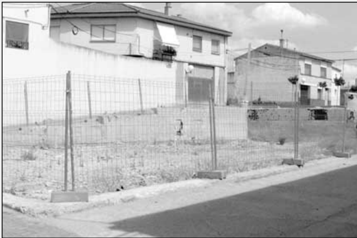
Los solares deben de estar cercados y limpios.

bueno, y finalmente la Junta de Gobierno Local, da el aprobado definitivo para la realización de las obras. Todas los trabajos de albañilería o reformas que se realicen dentro del término municipal necesitan una licencia, tanto las exteriores, las que afectan o se ven desde la calle (incluido el pintado de fachadas, instalar aire acondicionado...) hasta las interiores que pueden afectar a cualquiera de las instancias de la casa. Estas licencias se conceden tanto para garantizar el cumplimiento de la normativa vigente en la localidad como para garantizar la seguridad en la misma. Además, hay que tener en cuenta que solamente existe un tipo de licencia de obras, independientemente de las dimensiones o alcance de las mismas.