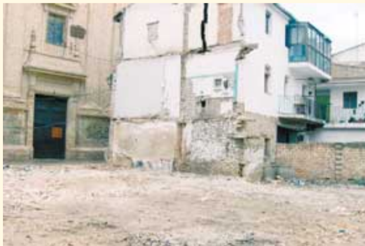
Algunos edificios necesitan ser reformados.

El consistorio ademàs, quiere realizar un censo de los solares vacíos que hay en la localidad. pág. 3