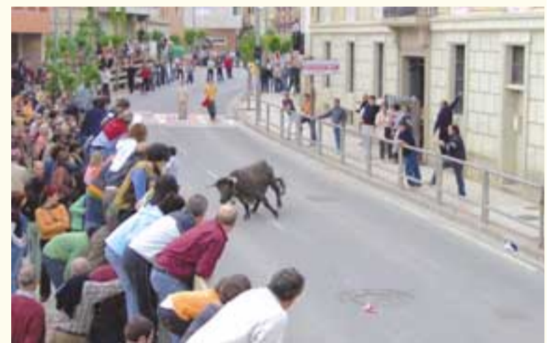
Las vacas no faltaron, el tiempo acompañó y el ambiente insuperable.

los piperos, la comida popular... Por la noche, el toro de fuego provocó las carreras de los más pequeños y no tan pequeños. Tampoco faltó una carrera de burros y el deporte rural que puso a prueba la habilidad de los participantes. El buen tiempo y el calor acompañó a los valtierranos en estas fiestas que, aunque están dedicadas a la juventud valtierrana, pudieron disfrutar todos los habitantes de la villa.