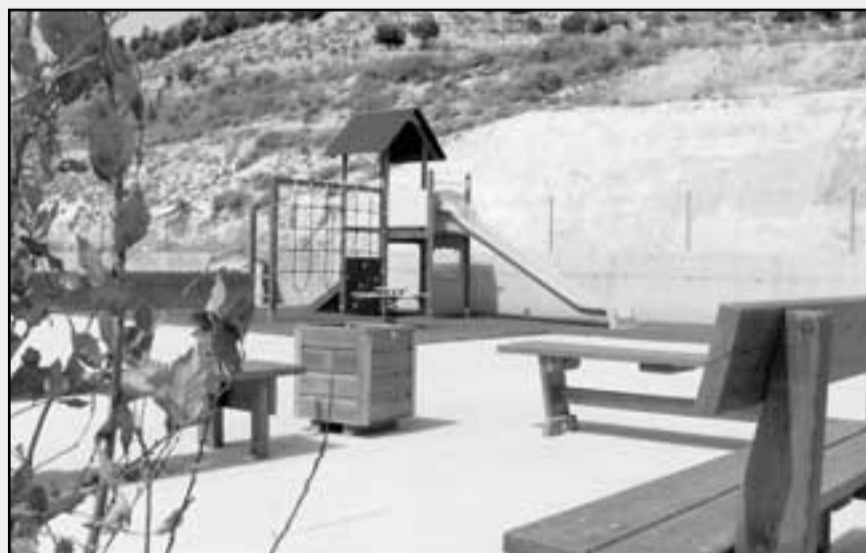
El nuevo parque y algunos de los elementos de juego.

de un ascensor exterior que permite acceder a las distintas plantas del centro evitando las escale-