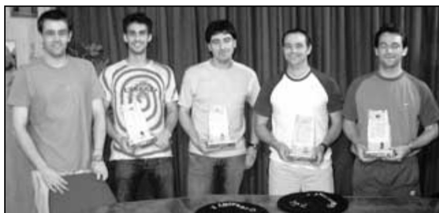
Las dos parejas finalistas posan con los trofeos.