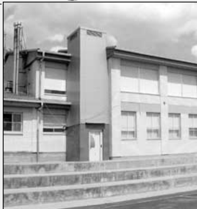
El ascensor elimina las barreras arquitectónicas.