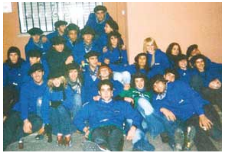
Los quintos de 1986 celebraron su día con buen humor.

celebraron siendo jóvenes, en Semana Santa, concretamente el Domingo de Pascua.