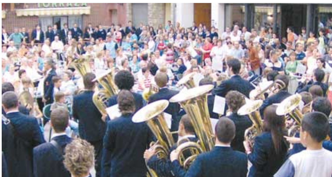
Las Bandas actuaron con gran asistencia de público.

tas localidades navarras de puntos tan diversos como Ablitas, Marcilla, Zizur Mayor, Aibar, Berriozar y la banda de la localidad. Durante la mañana