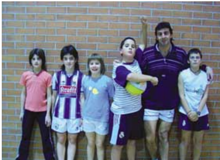
El polideportivo acoge por primera vez un curso de baloncesto.

par con la puesta en escena de una coreografía.