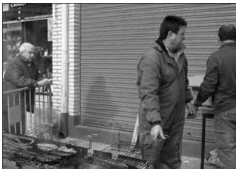
Los empleados de la brigada municipal prepararon el almuerzo.