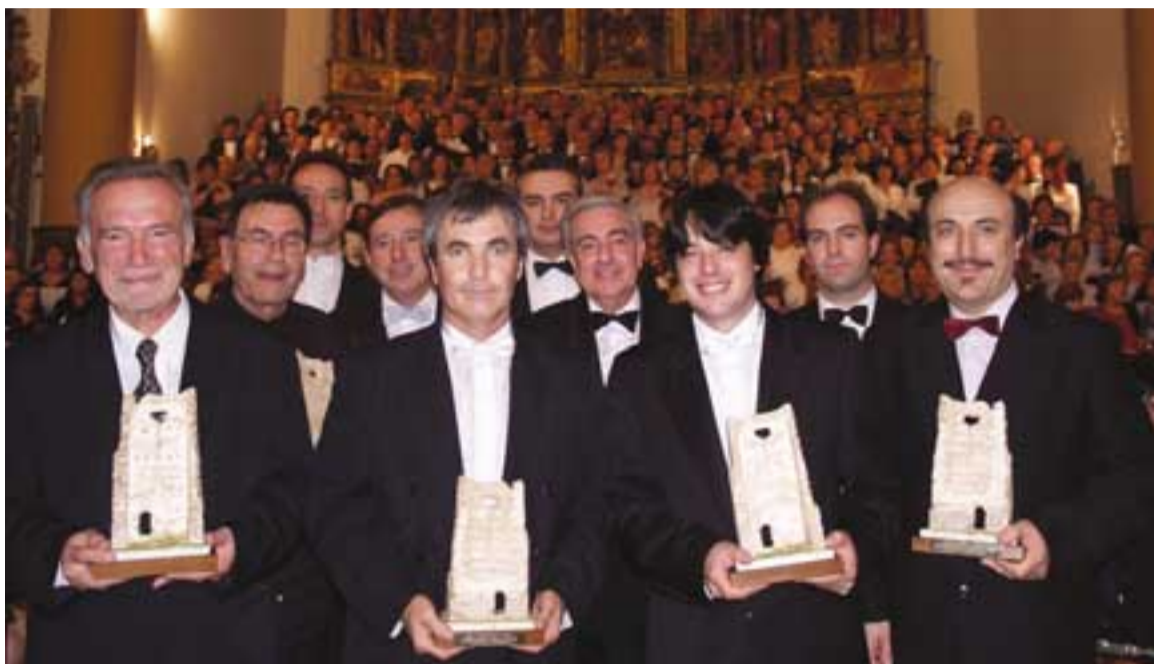
Los directores recibieron una réplica de la Torreza.

Las diez corales que participaron fueron: la coral Virgen del Yugo de Arguedas, Virgen de la Paz de Cintruénigo, Virgen del Amparo de Castejón, Virgen del Olmo de Azagra, Coro Arlas de Peralta, Coro Joaquín Gaztambide de Tudela, Orfeón Virgen del Villar de Corella,