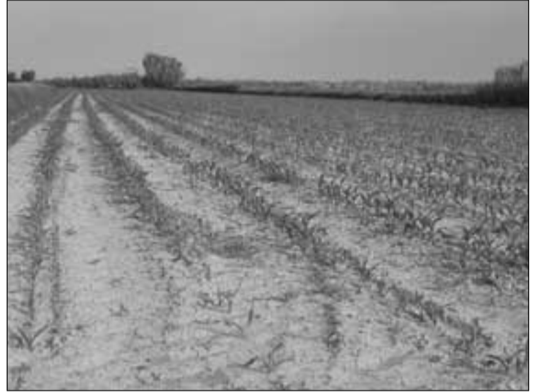
La concentración parcelaria dará cabida a más empresas agroalimentarias.

En el momento en que el estudio y las bases de la concentración estén finalizadas, se expondrán públicamente a los propie-