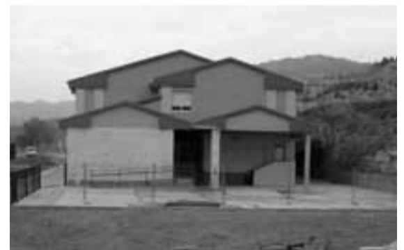
El patio se ampliará hacia la zona de las escuelas.

La ampliación de esta zona se destinará a los niños de 3 a 6 años y tendrá el mismo pavimento que el original así como un vallado a lo largo del perímetro.