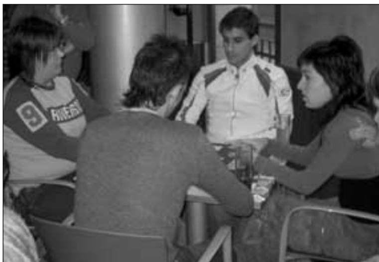
Los jóvenes participaron en la Ginkana Interpeñas.

Estos cinco días de charlas y coloquios se iban a cerrar el viernes con la ponencia "Dietética y