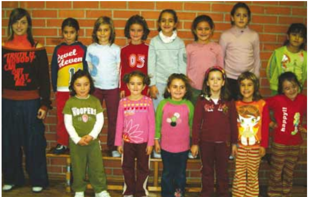
Las alumnas de funky-hip-hop participarán en el festival de Navidad.

Además se está preparando ahora por Navidad, aunque es algo que aún está por concretar, la posibilidad de realizar un Festival Infantil en el que las niñas de funky podrían partici-