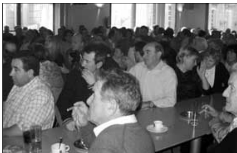
El Centro Cívico se llenó con los conciertos.