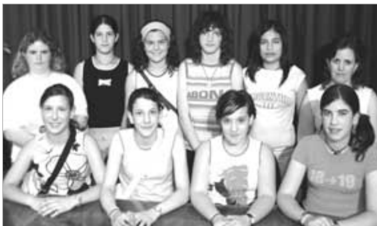
Los participantes crearán un magazine.

Una docena de jóvenes de Valtierra de entre 13 y 17 años participa durante este mes de junio en un taller audiovisual en Valtierra Televisión. La actividad se desarrolla las tardes de los viernes de este mes, y el objetivo es realizar un programa magazine para que sea emitido durante el verano por la cadena de televisión local. Organizado por la Asociación Valtierra Joven, el taller está siendo impartido por los colaboradores habituales de Valtierra Televisión.