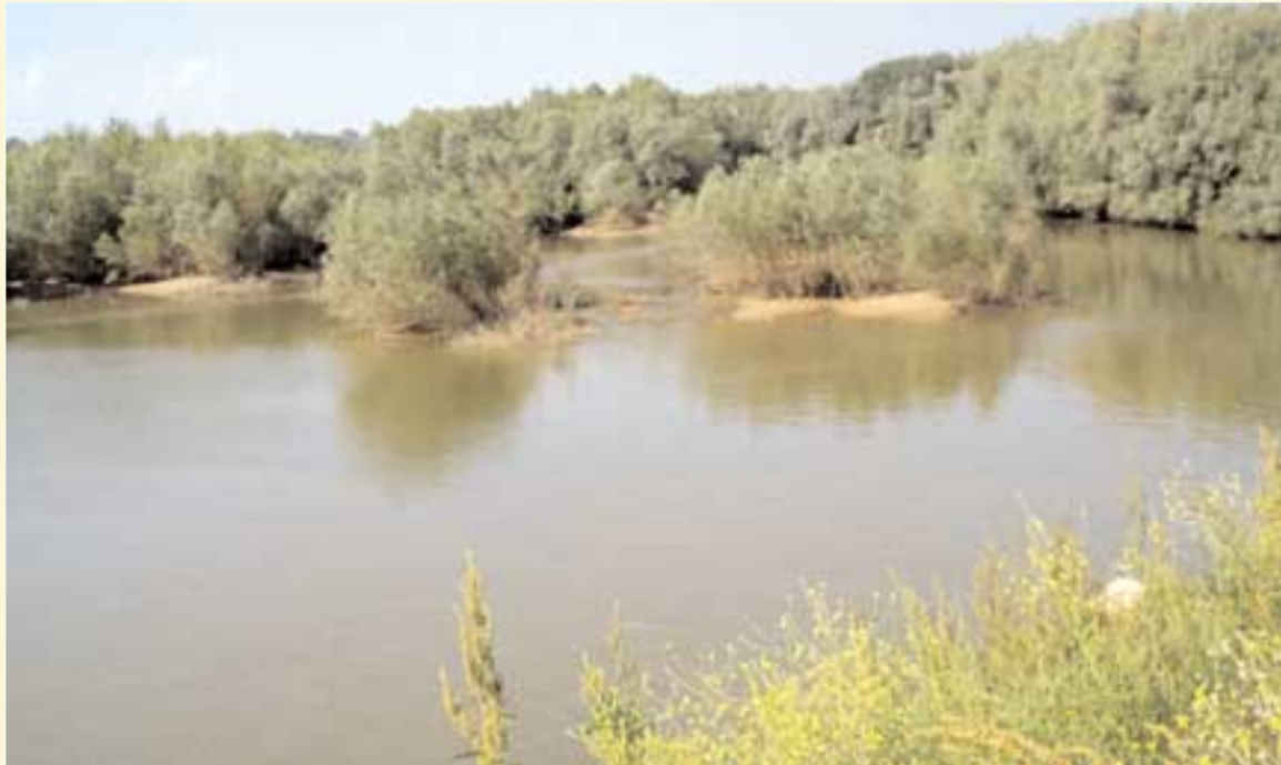
El Ebro juega un papel importante en el desarrollo sostenible de Valtierra.

El proceso se inició en octubre de 2003, y contó con la participación e implicación de las autoridades políticas, personal técnico, agentes sociales y económicos, y vecinos de Valtierra. En la actualidad, este municipio ribereño ya tiene redactado su Plan de Acción Local hacia la Sostenibilidad. Con él se quiere responder a las principales fortalezas y áreas de mejora detectadas en la fase previa de diagnóstico, y se compone de líneas estratégicas, programas y proyectos de acción que tratan de esbozar el modelo de