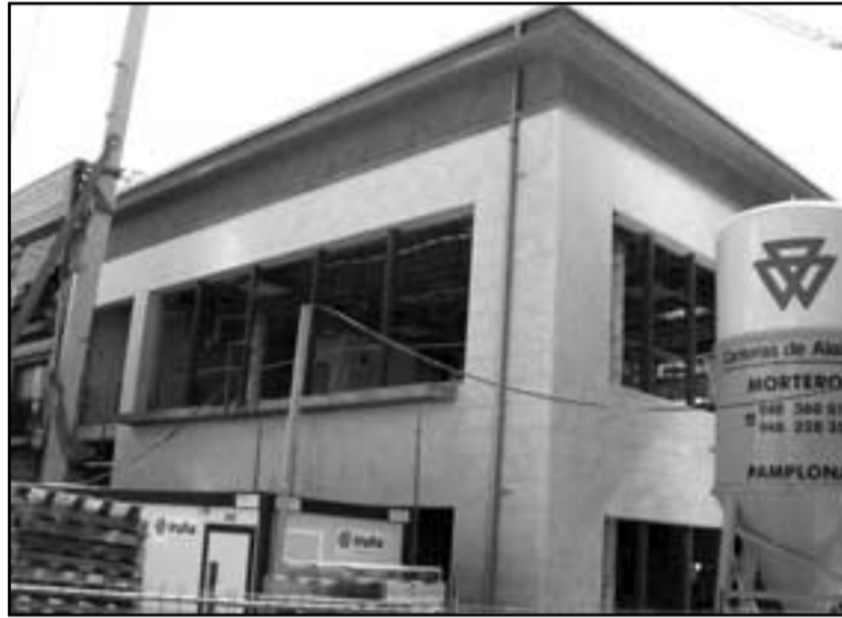
El Centro Cívico abre sus puertas en la primera quincena de agosto.

Con esta medida, lo que se pretende es no perjudicar a los valtierranos que pagan la cuota mensual respecto a aquellos que renuncien a hacerlo. No obstante, no se va a colocar un guardián en la entrada, sino que será el Consejo Rector el que vele por que esto se cumpla. Los mayores de 70 años podrán acceder al local sin tener que pagar cuota, siempre y cuando antes hayan abonado las canti-