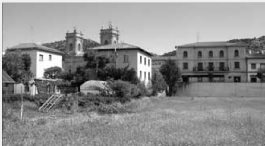
El ganado se situará en un solar privado del número 89 del Paseo de la Ribera.

Una de las principales novedades de las fiestas de San Ireneo 2005 afecta a la ubicación de los toriles, que en esta ocasión se situarán en un solar privado de uso urbano en el Paseo de la Ribera, junto al número 89. Se trata de una cesión temporal y provisional, a la espera de que en años próximos, el Ayuntamiento de Valtierra defina el lugar idóneo para la instalación de los toriles, ya que la antigua ubicación, cerca de la