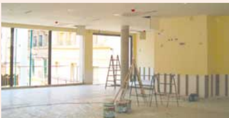
Una de las cuatro plantas del centro cívico.

El Centro Cívico ya cuenta con reglamento propio y comenzará a funcionar antes de fiestas. pág. 3