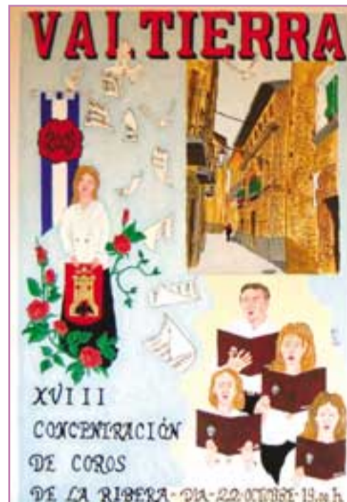
Cartel de la concentración de corales que se celebrará el próximo 22 de octubre.

El aforo es limitado y en anteriores ocasiones mucha gente se ha quedado fuera del recinto donde ha tenido lugar el concierto. Por ese moti-