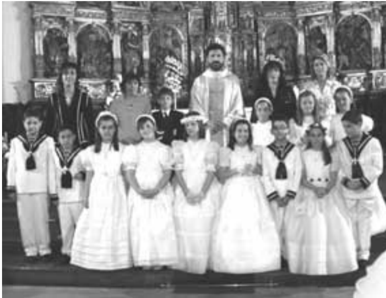
Los comulgados, junto al párroco y sus catequistas.