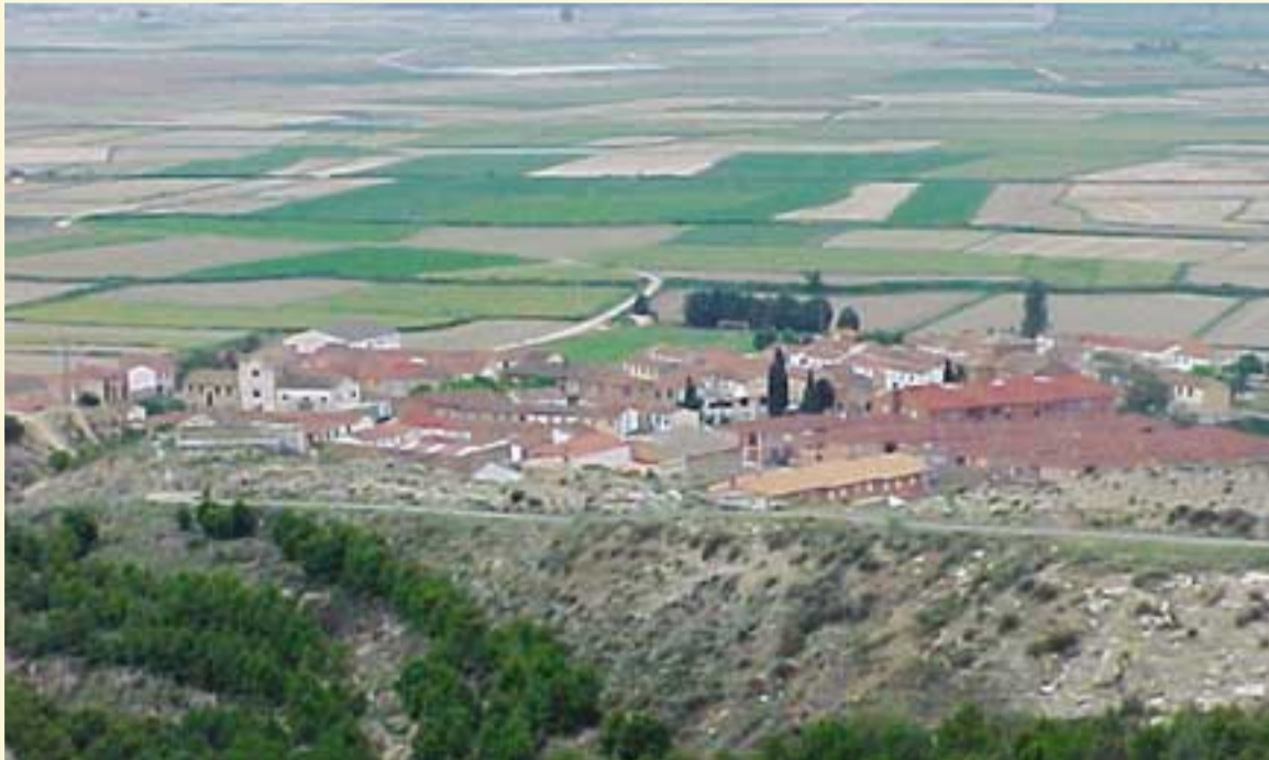
Valtierra define cómo quiere su desarrollo presente y futuro.

En el programa "Gestión adecuada de los espacios naturales