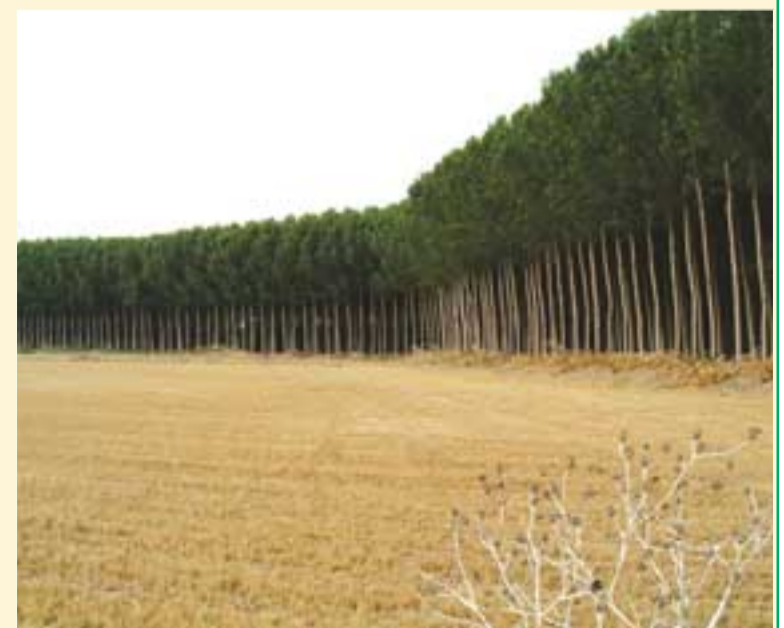
La agricultura juega un importante papel en el desarrollo.

cuentan con Agenda Local 21. Esta red viene a ser un excelente foro para intercambiar experiencias en torno a la implantación de la Agenda Local 21 y sirve para impulsar la transmisión del mensaje sobre sostenibilidad. Asimismo, puede ejercer presión para que las políticas extramunicipales se orienten a conseguir un desarrollo sostenible, mientras que otros objetivos son buscar apoyos financieros para la sostenibilidad; intercambiar experiencias, ideas y proyectos con otras entidades locales que han apostado por la sostenibilidad, y generar proyectos comunes.