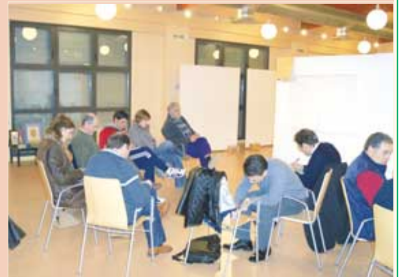
pie de foto

nos de ese pre-diagnóstico); Plan de Acción hacia la sostenibilidad; Plan de Seguimiento y Declaración Ambiental-Informe Síntesis.