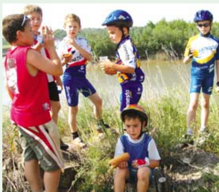
Un alto en el camino para reponer fuerzas.

ron en la plaza de Valtierra para salir sobre las diez menos cuarto de la mañana hacia el Soto del Ramalete y dirigirse después al Montarrón, donde se