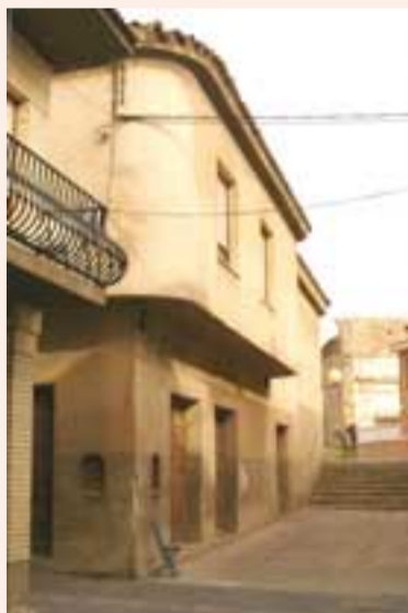
Los viejos cines serán demolidos.