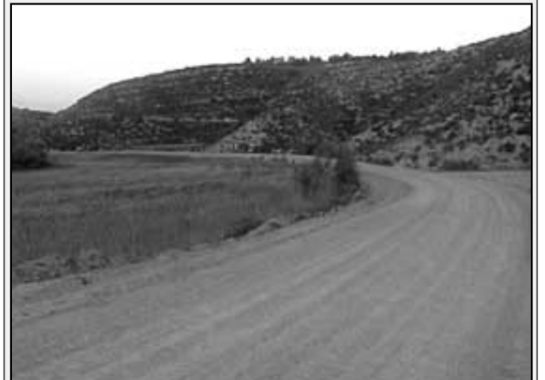
Los valtierranos dijeron "sí" en las urnas.

Numerosos caminos enclavados en el comunal de Valtierra han sido restaurados gracias a las ayudas para el arreglo de las infraestructuras agrarias dañadas por las tormentas e inundaciones del 7 y 8 de septiembre de 2004. Estas ayudas dependen al cien por cien del Gobierno de Navarra. Los daños van desde el descalce y pérdida del firme, hasta el lavado y arrastre del firme quedando el material suelto. Los caminos afectados son: Camino Nuevo, Camino debajo de Bornax, Camino Cañada pasada 4, Alto de la Sierra, Tres Mugas, Cuesta Portillo Guitón, Barranco de Gallonga y Cuesta de los Pilares. El presupuesto de las obras ha ascendido a 50.000 euros y han tardado en ejecutarse, por parte de la empresa Tracsa, entre quince y veinte días.