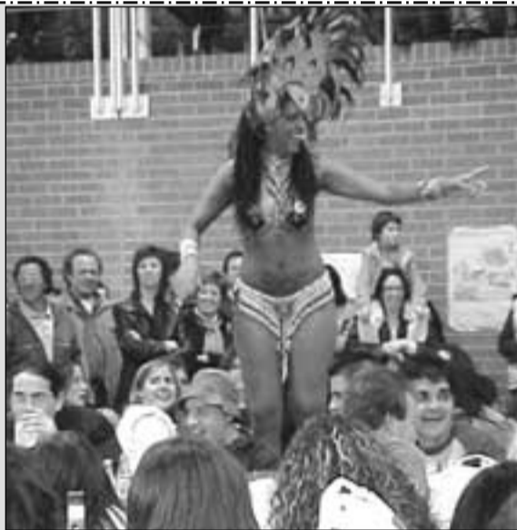
Foto 7: Los "lanzadores" de puntas de espárrago. Foto 8: Bailes brasileños en la sobremesa. Foto 9: Exhibición de Quads.

Las Fiestas de la Juventud 2005, celebradas del 1 al 3 de abril, obtuvieron un éxito rotundo en participación. Organizadas por el Club Juvenil La Higuera, contaron entre otros actos con el Concurso de calderetes y repostería, el II Certamen internacional de Lanzamiento de Puntas de Espárrago, los bailes brasileños del grupo Rio Samba Show, una exhibición de quads y la tradicional suelta de vaquillas y ganado bravo por la carretera. El tiempo fue favorable excepto la lluvia que cayó la mañana del sábado, lo que permitió que ninguno de las actividades previstas quedase deslucida.