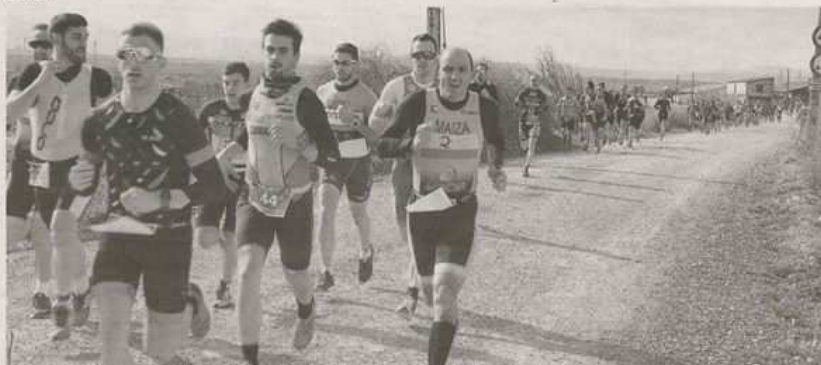
Un grupo de corredores, durante uno de los tramos a pie del VI Duatlón de Valtierra, que contó con 250 participantes.