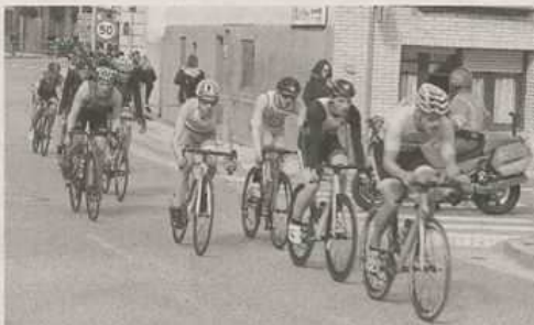
Imagen del sector en bicicleta a su paso por una de las calles de Valtierra.

Por su parte, en categoría masculina, Santamaría, que hizo un tiempo de 1 hora, 2 minutos y 16 segundos, se impuso en la carrera,