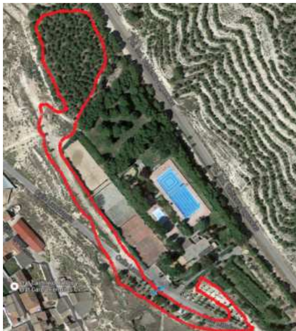
Primera vuelta, circuito