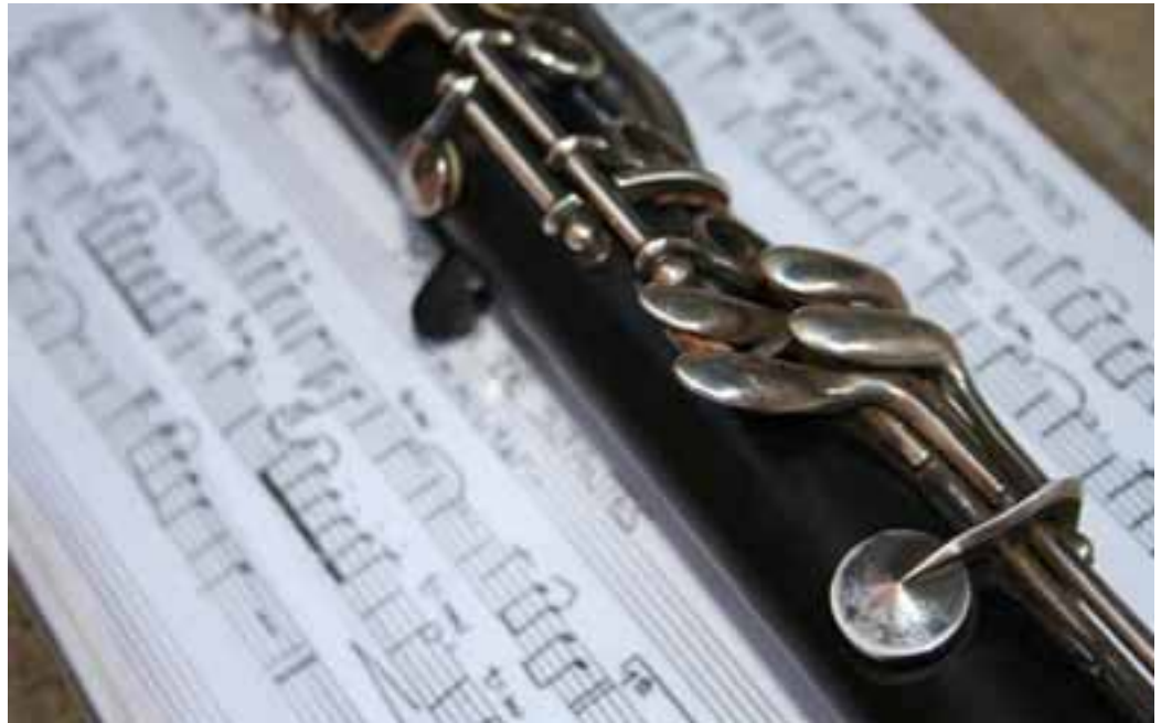
Detalle de una partitura.

El Ayuntamiento ha recibido con buenos ojos la propuesta de muchos padres y madres cuyos hijos asisten a la Escuela de Música de Valtierra que proponía que se tuviese en consideración la posibilidad de efectuar un descuento en el pago de las tasas en dicha Escuela, en el caso de familias numerosas.