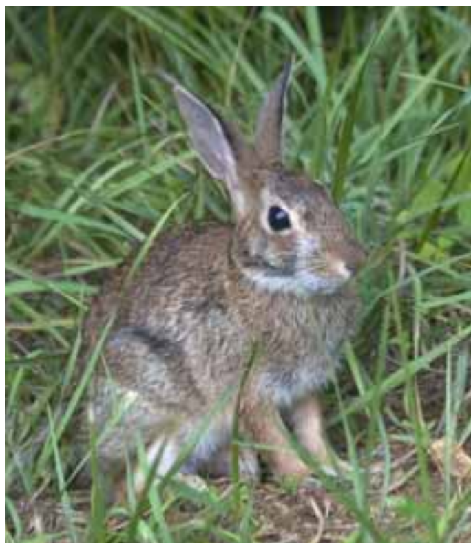
Un conejo mantiene la alerta.

mento para la Escuela Municipal de Música en el apartado quinto, letra C, párrafo segundo, introduciendo una modificación en el sentido de que en el caso de familias numerosas que tengan un hijo en la Escuela de Música, tendrán un descuento del 20% de la tasa. En el caso de que se diera la circunstancia de que una familia tuviese tener dos hijos en la Escuela de Música, tendría un descuento del 20% por el primer hijo y el 30% por el segundo y así sucesivamente.