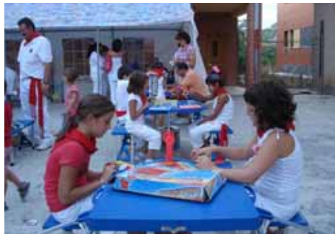
Los niños tuvieron diferentes actividades estas fiestas.