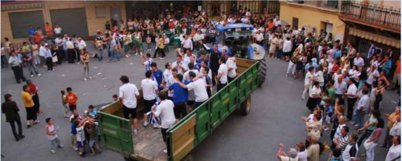
Los miembros del C.A. Valtierrano son vitoreados a su llegada a Valtierra.