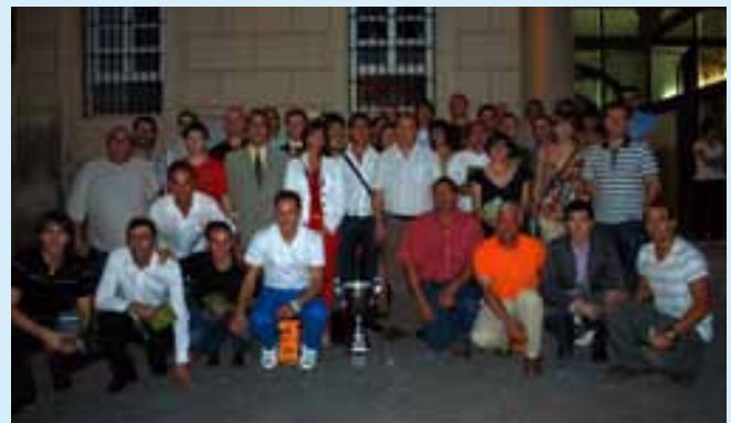
El equipo posa tras el acto de homenaje.