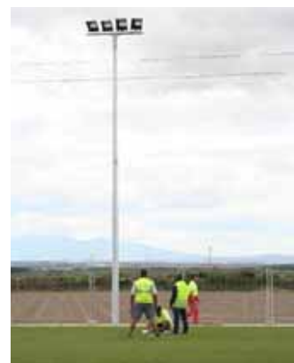
Campo de fútbol 7.

COSTE. Desde que comenzaron las obras el pasado mes de enero, han sido muchas las modificaciones que éste ha sufrido. Finalmente, la construcción del nuevo campo de fútbol tendrá un coste total de algo más de 1.300.946,81 euros.