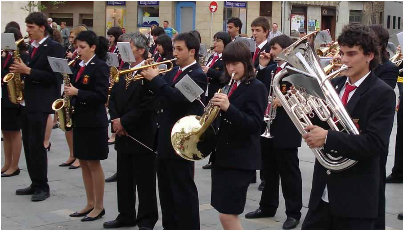
La Banda de Música de Valtierra en una actuación ofrecida en Tudela.