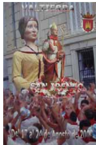
Cartel anunciador de las fiestas.