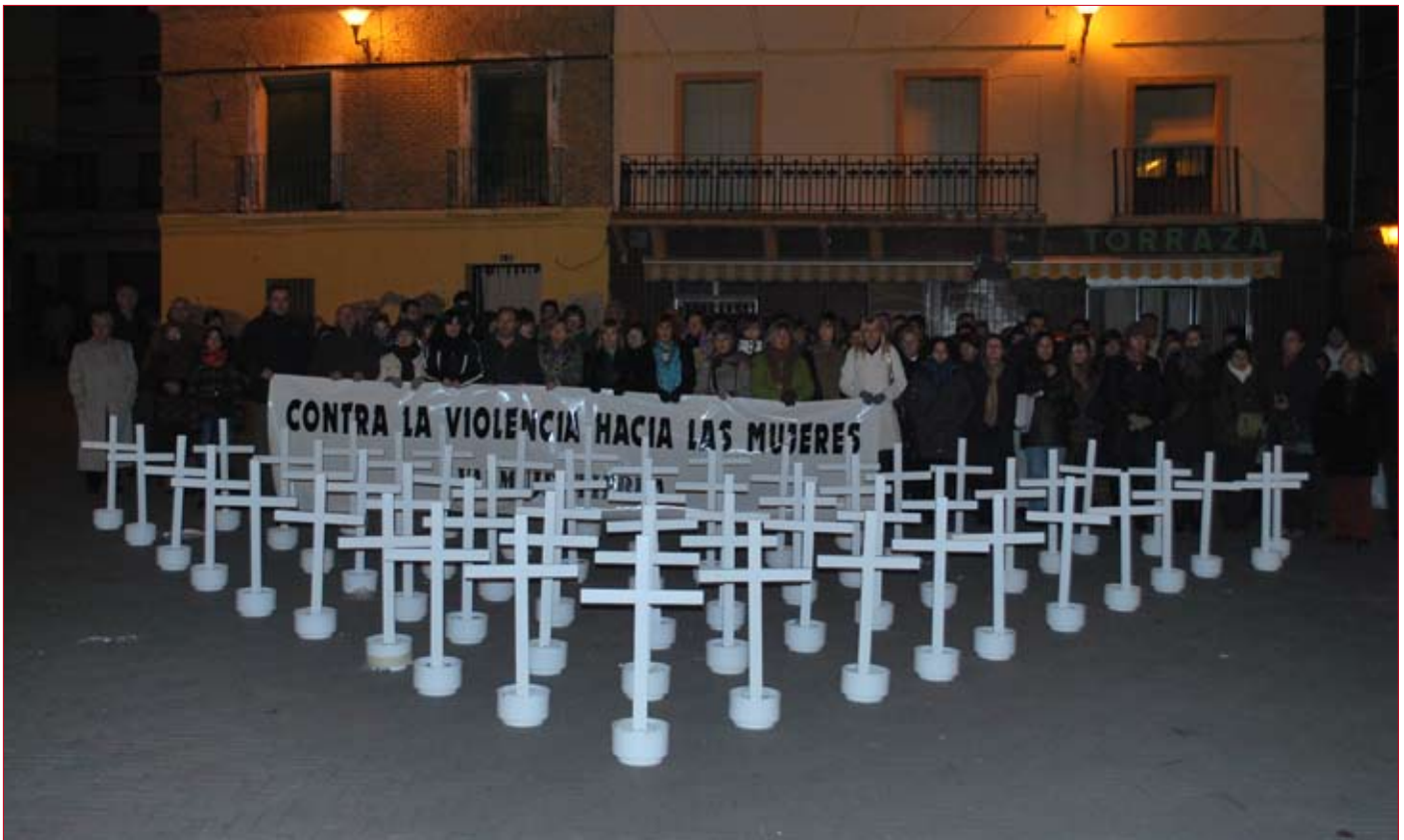
El recién formado colectivo se manifiesta en contra de la violencia de género.