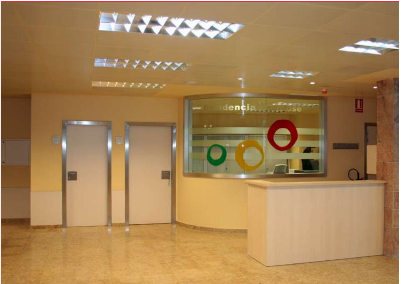
La recepción es un área espaciosa y con mucha luminosidad. / ENFOQUE.