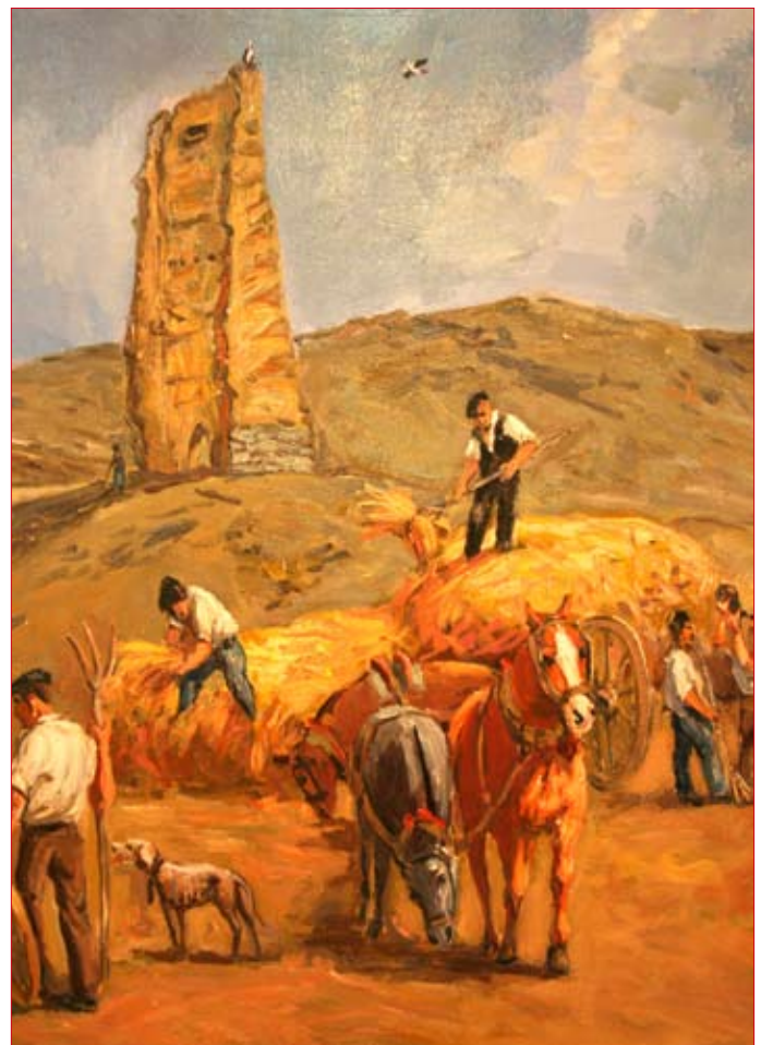
Detalle del cuadro adquirido por el Ayuntamiento de Valtierra.

Tiene realizadas en total unas cincuenta tallas de madera en piedra y mármol de tamaño natural, además de unas trescientas pequeñas de cerca de 50 cm y unos cuatrocientos cuadros que comprenden paisajes, retratos al óleo, acuarelas, etc.