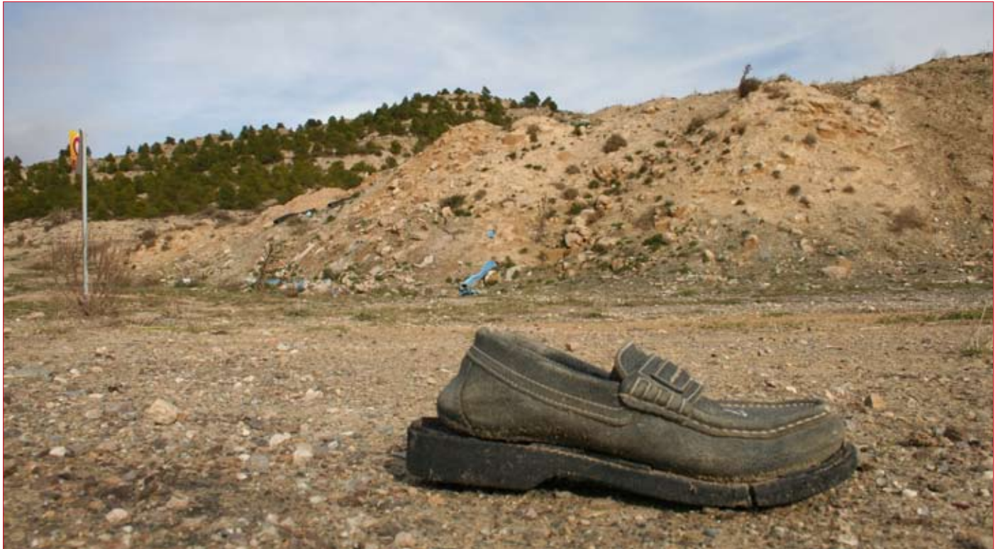
La mala utilización de la escombrera ha propiciado que también existan otro tipo de desechos. / ENFOQUE.