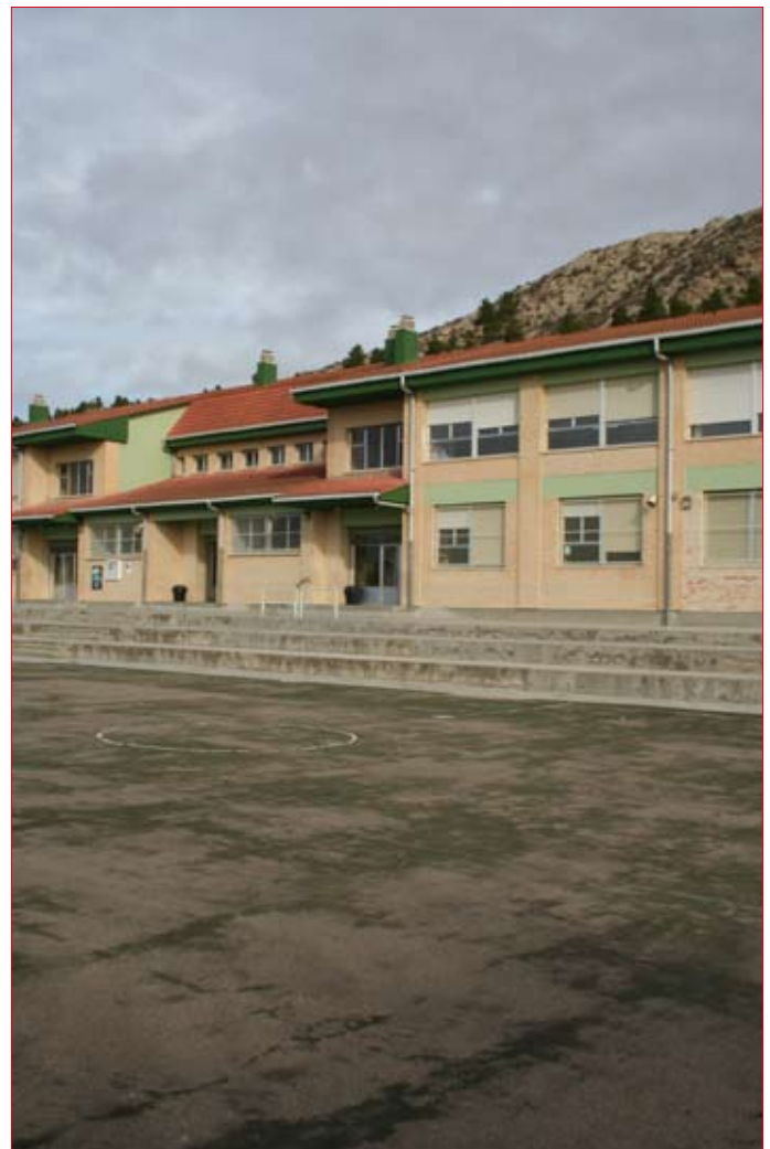
El Colegio Público Félix Zapatero apuesta por la enseñanza de idiomas . / ENFOQUE.

Desde el centro se quiere realizar una fuerte apuesta por la enseñanza de idiomas y además del más que posible voto favorable para proponer la candidatura, desde el centro se quiere recordar que también existe la posibilidad de elegir el euskera como asignatura. Para ello, se precisa de un número mínimo de 15 alumnos por curso. En tal caso, y de adoptarse el Plan TIL, dichos alumnos, recibirían 12 clases en castellano, 12 en inglés y 4 en euskera.