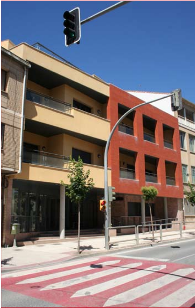
El nuevo edificio cuenta con todos los servicios necesarios. / ENFOQUE.