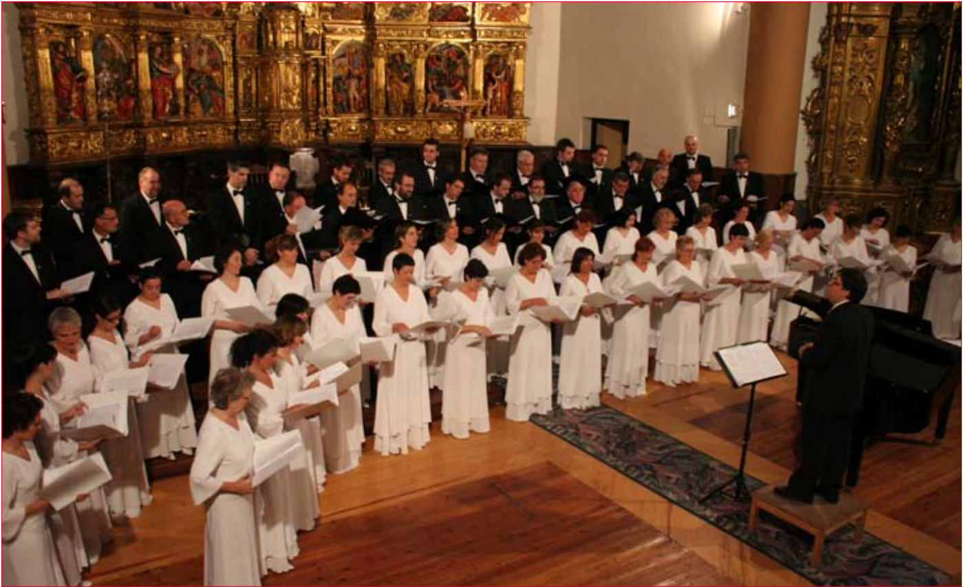
El Orfeón Pamplonés ofreció un variado repertorio de piezas musicales.