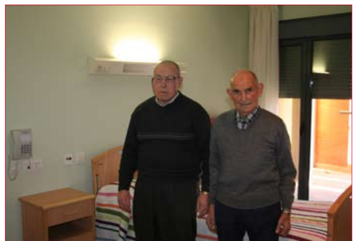
Los ancianos se mostraron satisfechos con sus nuevas habitaciones.