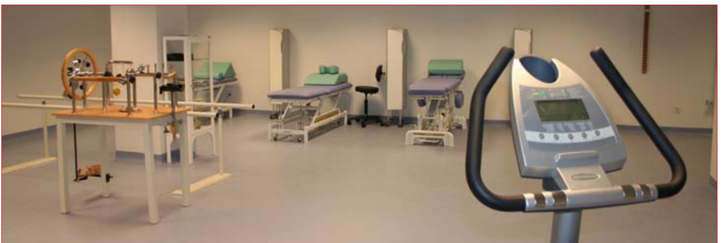
El gimnasio cuenta con un completo equipo de aparatos de ejercicios y rehabilitación. / ENFOQUE.