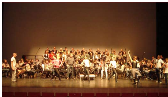
Momento del ensayo en Baluarte.