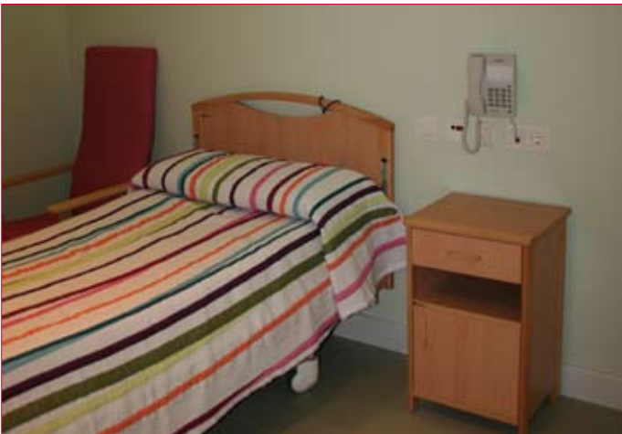
El centro tiene un total de 42 habitaciones. / ENFOQUE.