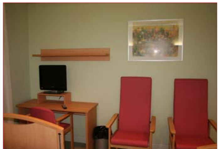
Todas las habitaciones cuentan con hilo musical y televisión de plasma.