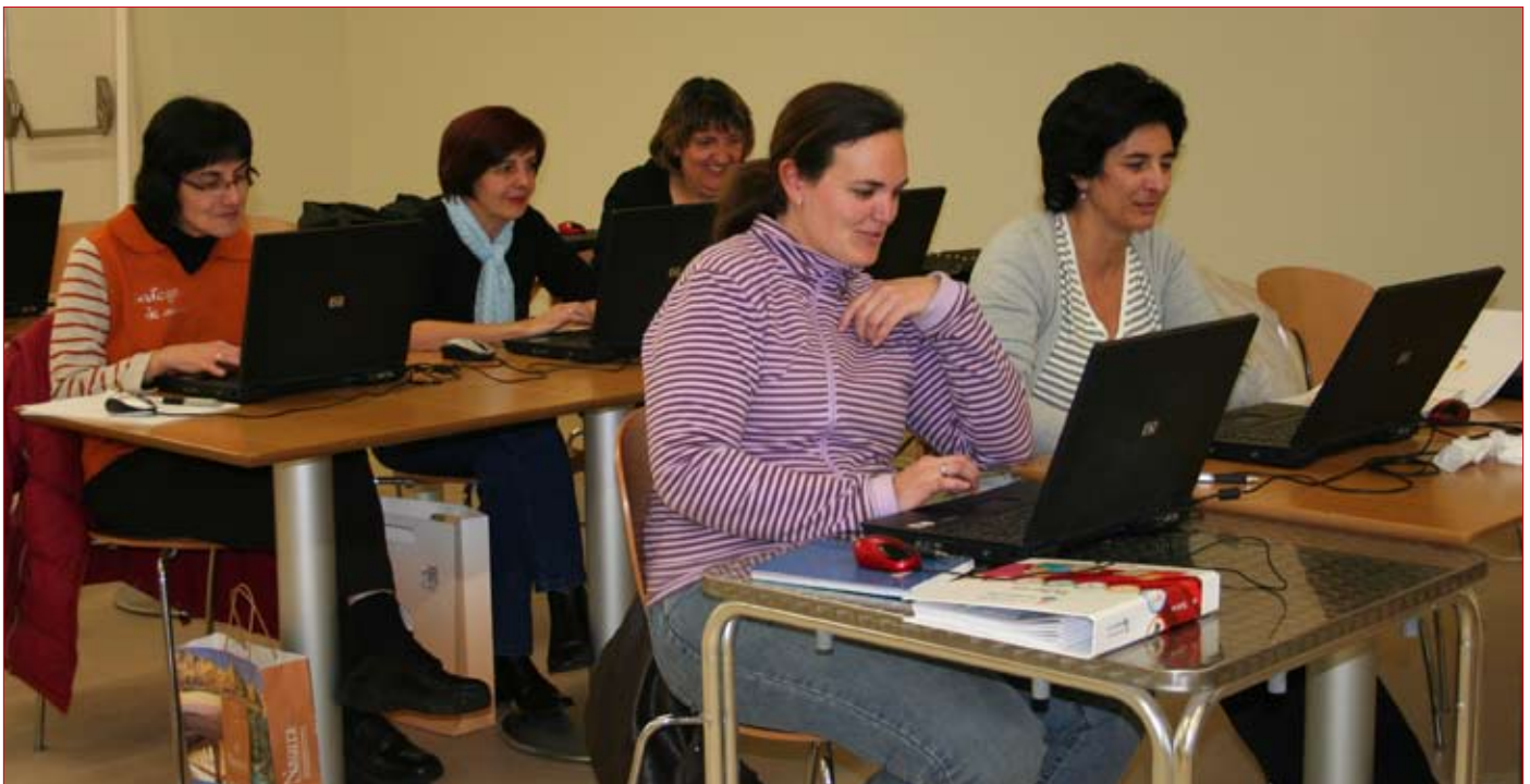
Los cursos se impartieron bajo el amparo de Consorcio Eder. / ENFOQUE

Cerca de 75 valtierranos y valtierranas se han beneficiado de los cursos de iniciación a las nuevas tecnologías que ha ofrecido el Ayuntamiento de nuestra localidad bajo el amparo de Consorcio Eder.