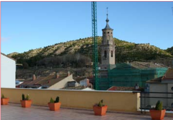
Desde la terraza de la planta superior se divisa gran parte del pueblo.