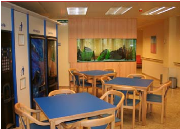
La sala de café está dotada con un magnífico acuario.