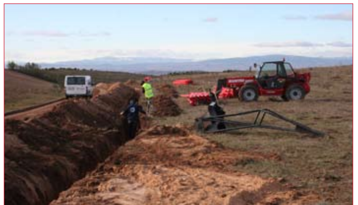
Las labores de canalización han sido las primeras en comenzar.

Una vez finalizado, el parque solar ocupará una extensión de 50 hectáreas y estará compuesto por unos 60.000 paneles fotovoltaicos. Cuando el parque funcione a pleno rendimiento, éste producirá anualmente unos 9,9 millones de kWh, energía equivalente a la consumida cada año por más de 5.000 viviendas. Además, la presencia del parque evita-