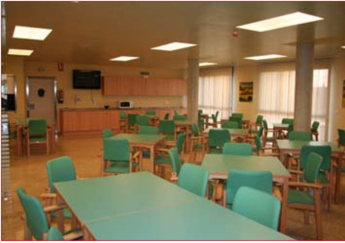
El comedor principal se sitúa en la planta baja del edificio. / ENFOQUE.