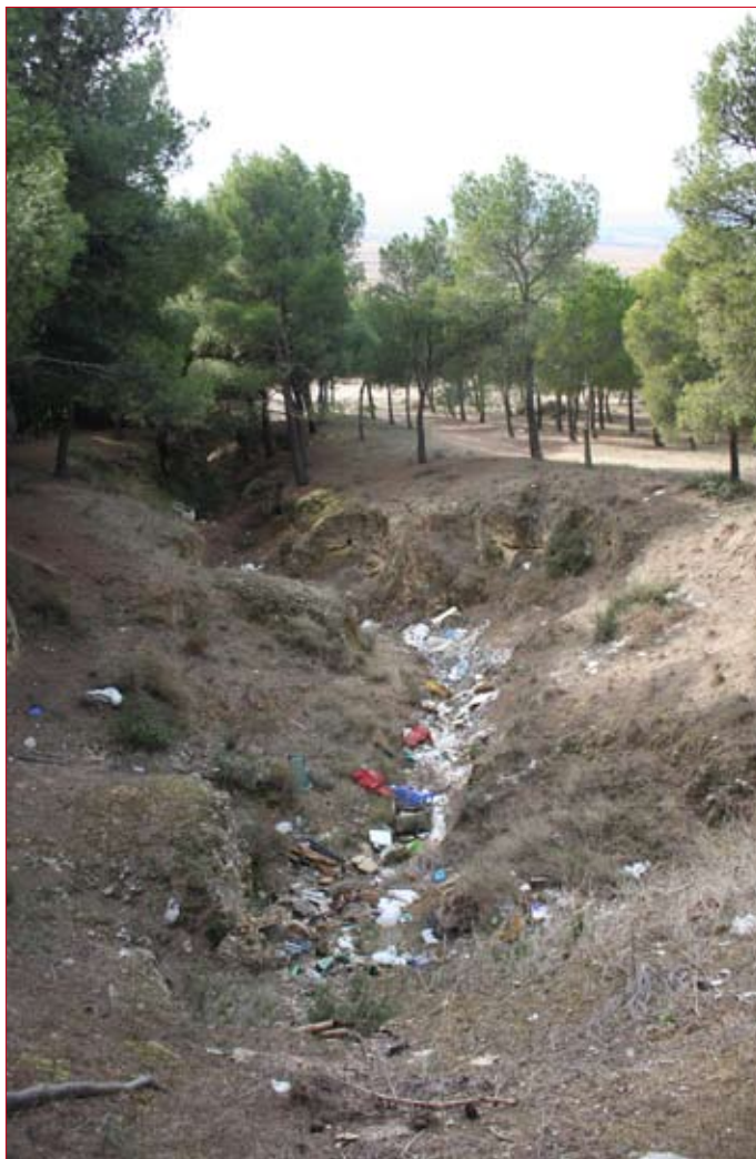
La basura también llega hasta los pies de la piscina. / ENFOQUE.

La empresa Guillén, Empresa Constructora ha sido finalmente la adjudicataria de las obras de sellado y restauración ambiental y paisajística de la escombrera municipal. El acuerdo, adoptado en pleno el pasado 5 de noviembre se cerró con una propuesta por valor de 72.318,14 euros, IVA incluido que alcanzó la máxima puntuación de acuerdo con el pliego de condiciones por las que se regía dicha adjudicación.