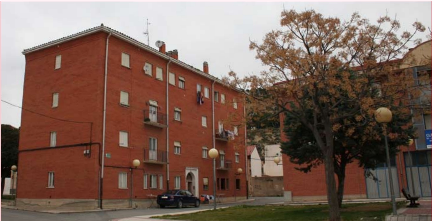
El edificio fue saneado y adecentado antes de su salida a subasta pública. / ENFOQUE.

Los popularmente conocidos como pisos de los maestros salieron a la venta por medio del sistema de subasta pública el pasado mes de octubre. En dicho trámite solamente uno de los pisos consiguió ser vendido. El piso en cuestión fue uno de los que conformaba uno de los cuatro lotes de pisos de 90,54 metros cuadrados y que salieron a subasta por un precio de 88.000 euros.