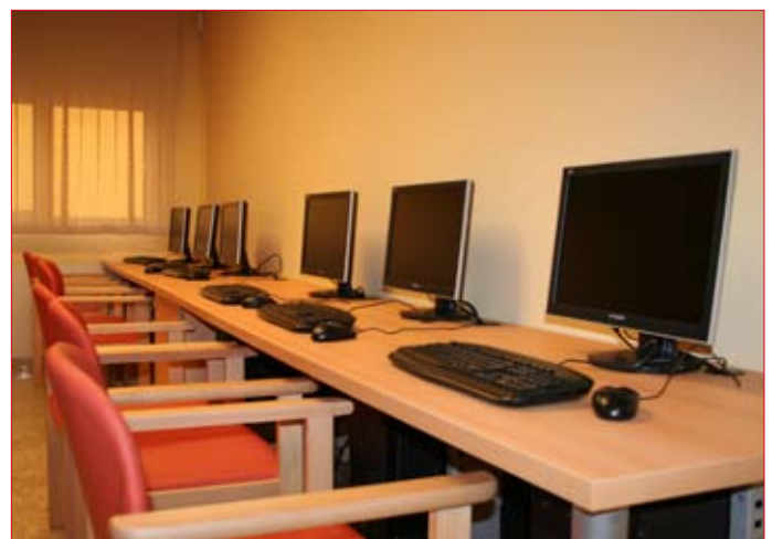
Las nuevas tecnologías también están presentes.