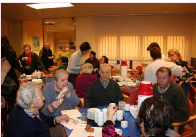
Los 26 residentes celebraron su traslado con un aperitivo.