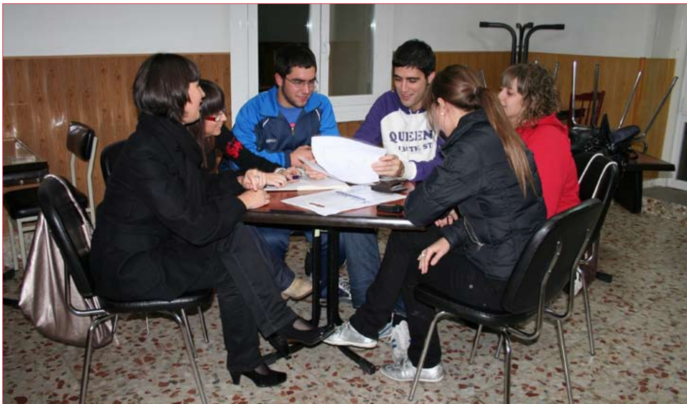
La Junta del Club Juvenil se empleó a fondo en la organización del día del socio.